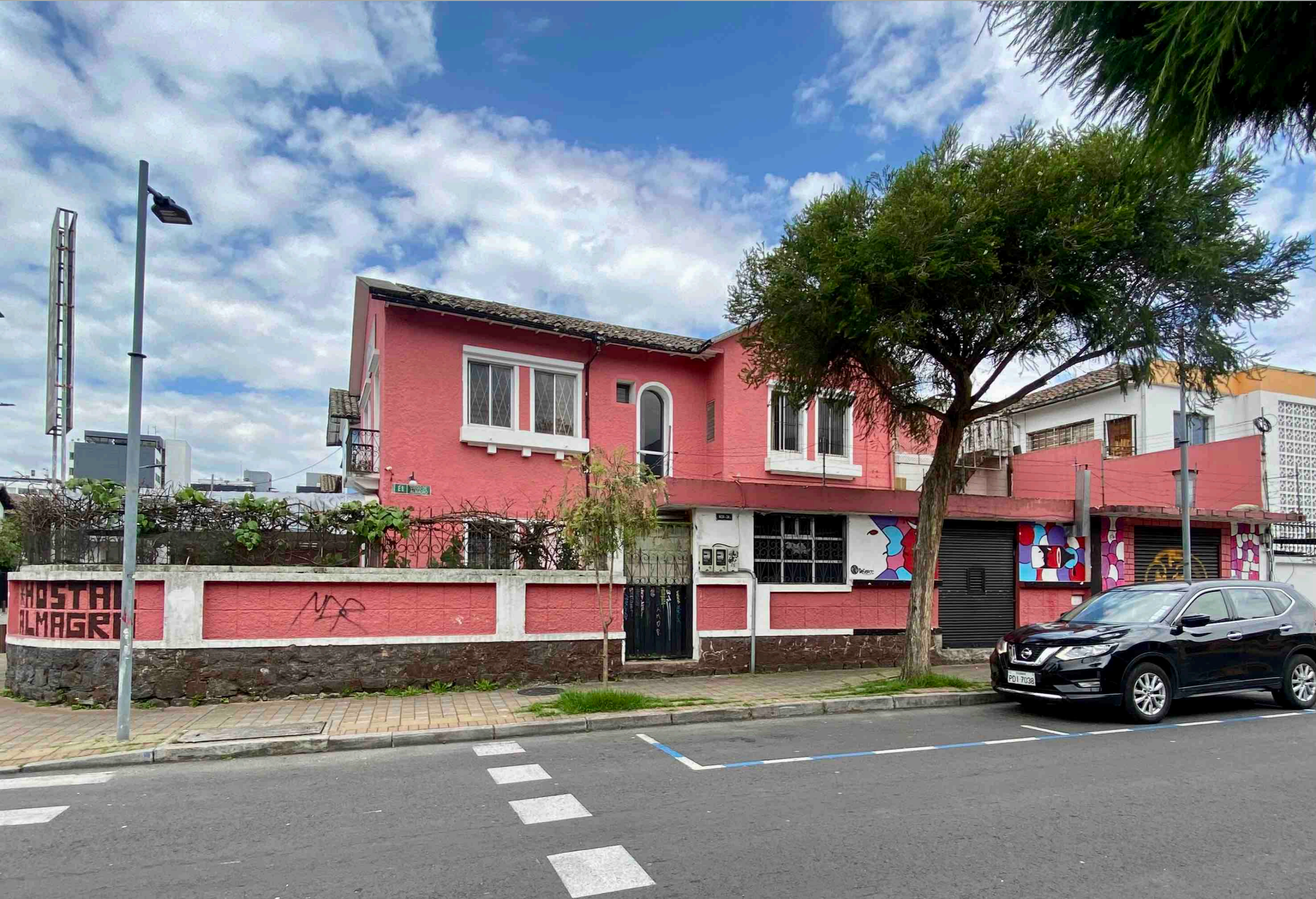
Diego de Almagro y Foch