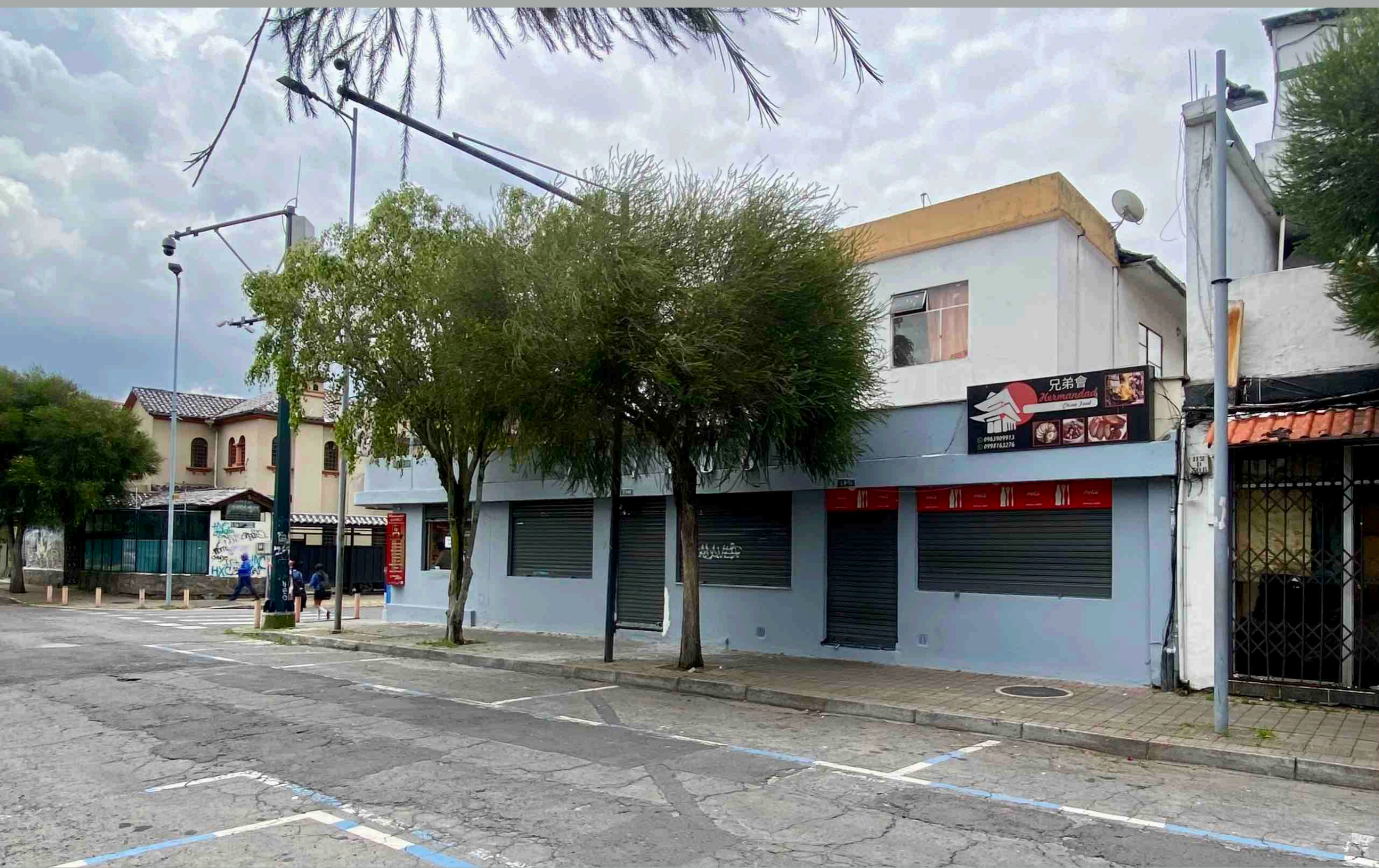
Wilson y Diego de Almagro -no patrimonial probablemente-