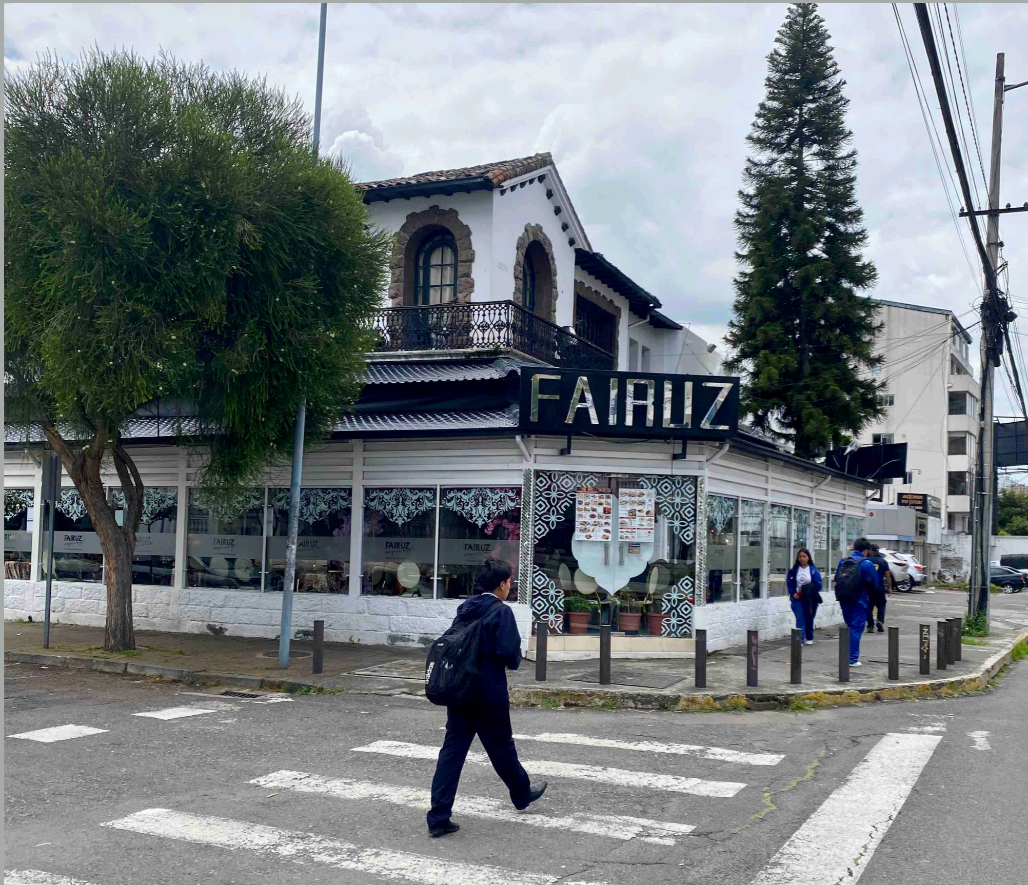
6 de diciembre y Baquedano