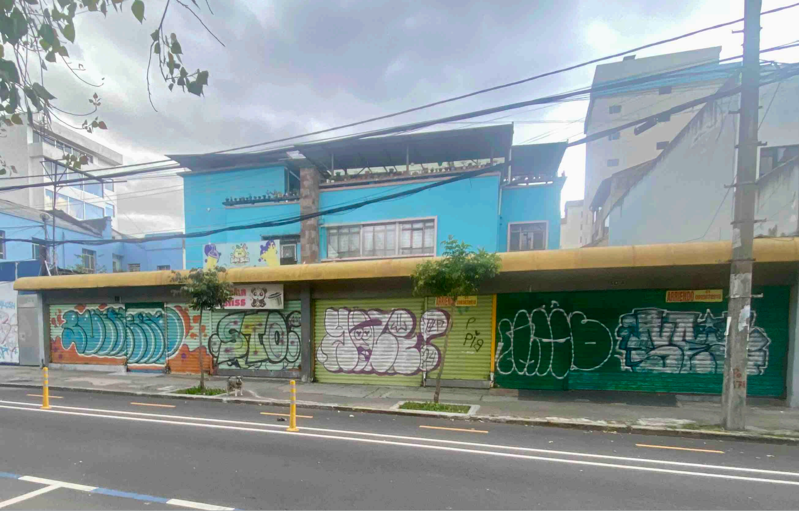
Carrión y Amazonas -Casa familia Pinto-