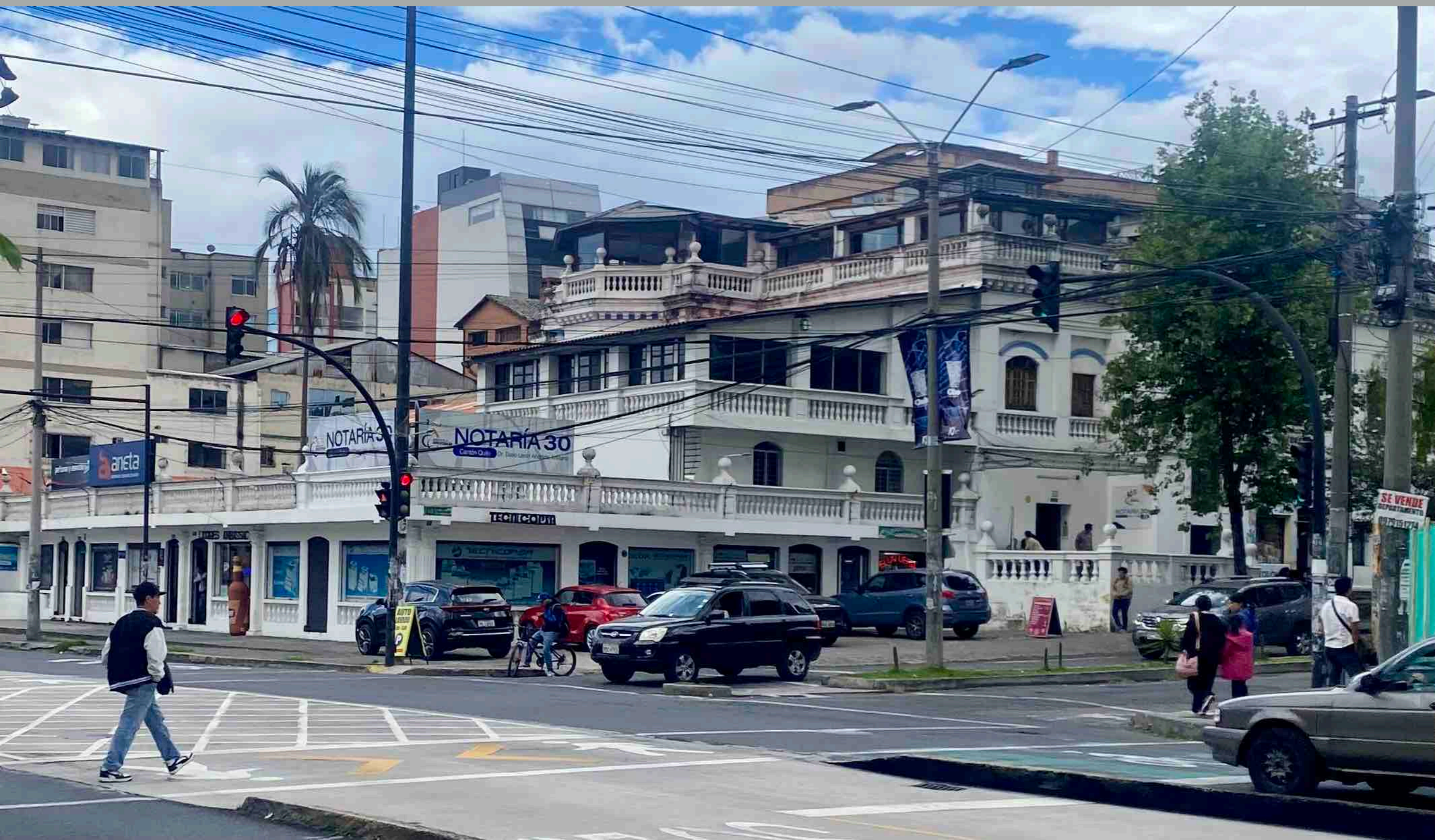
Veintimilla y 6 de diciembre -Villa Gloria-