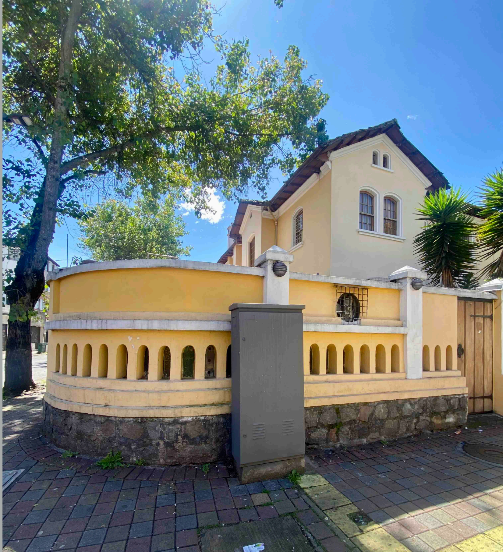
Foch y Juan León Mera