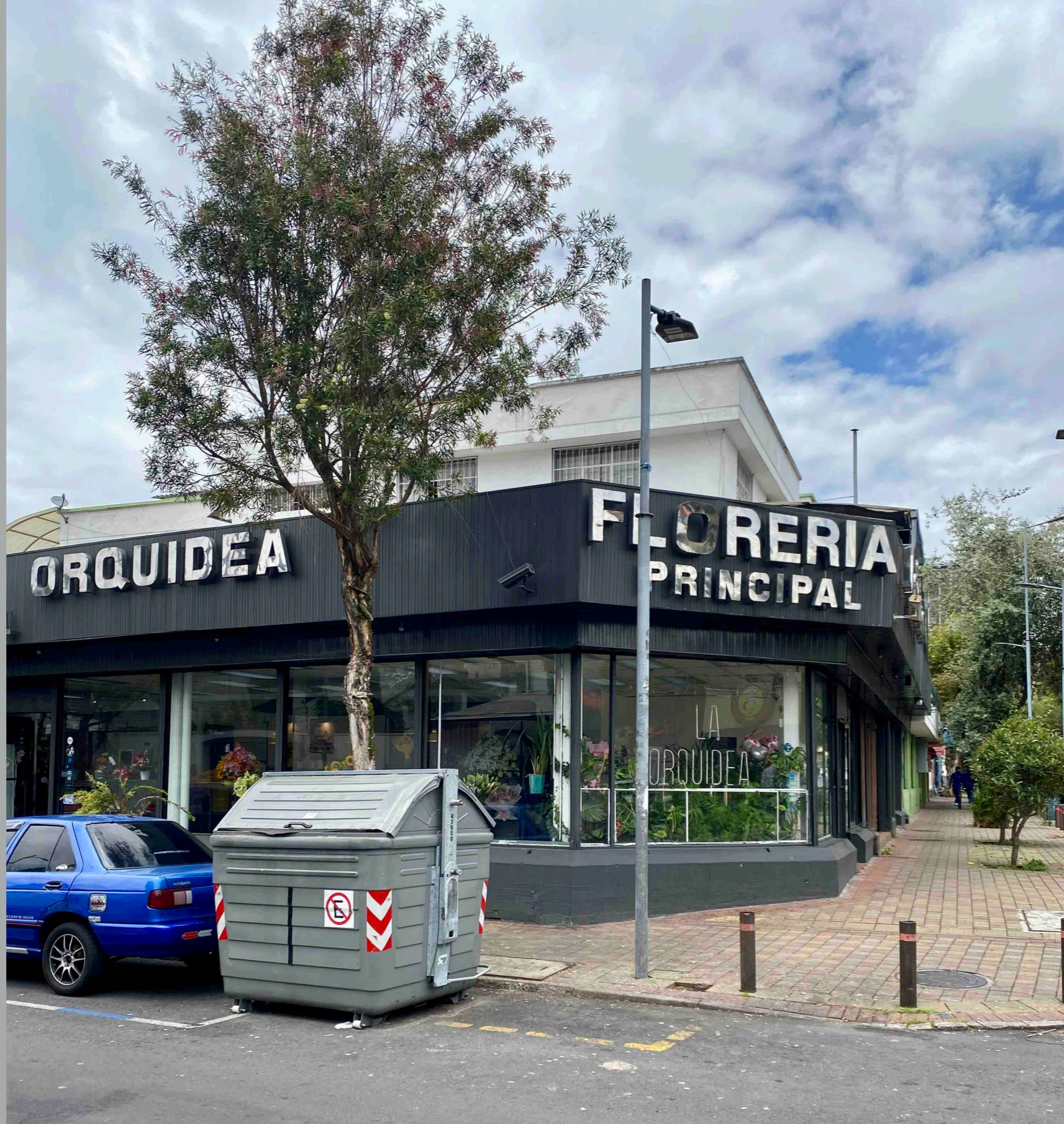
Diego de Almagro y Calama -Florería (más de 25 años)-