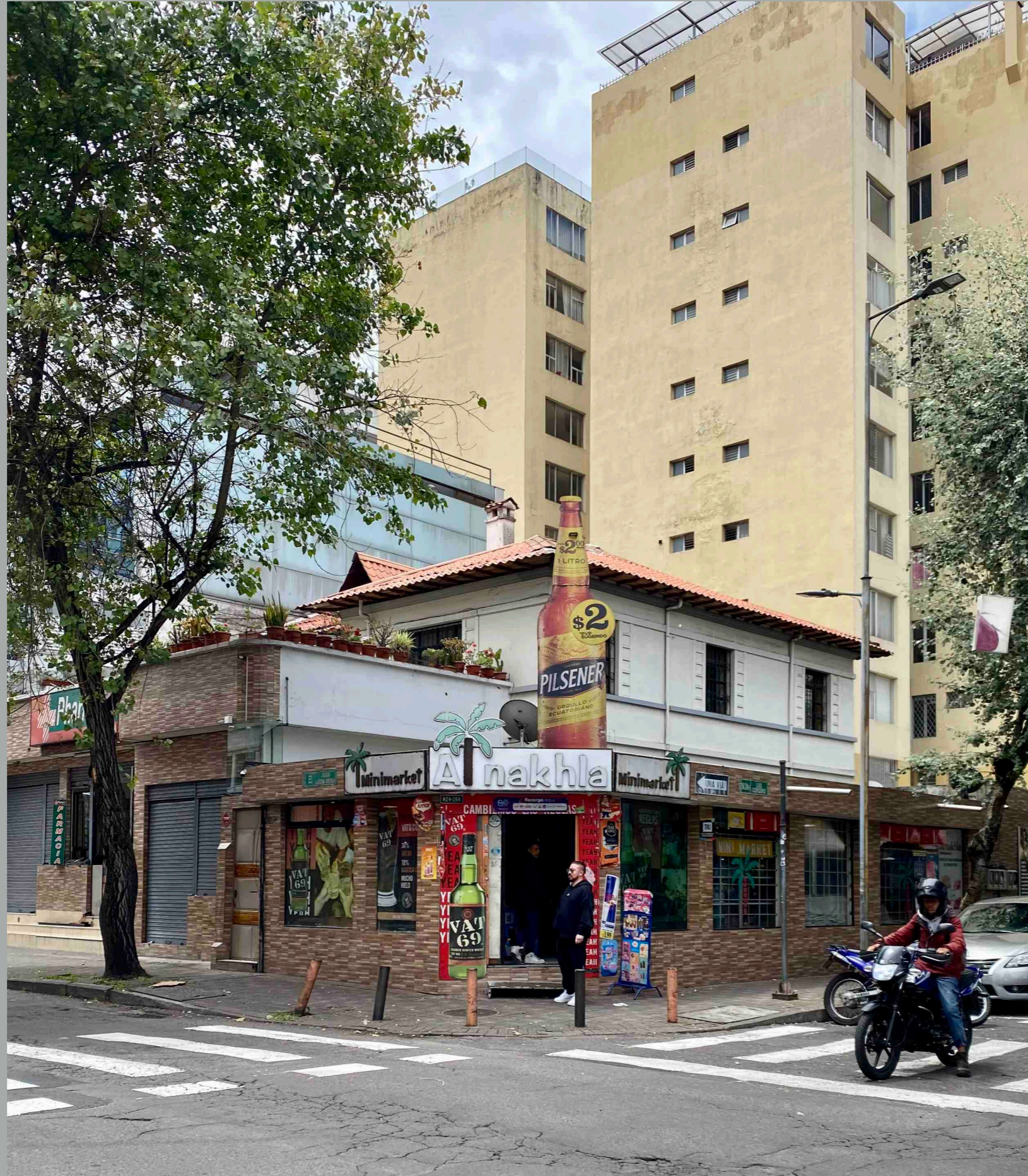
Luis Cordero y Juan León Mera