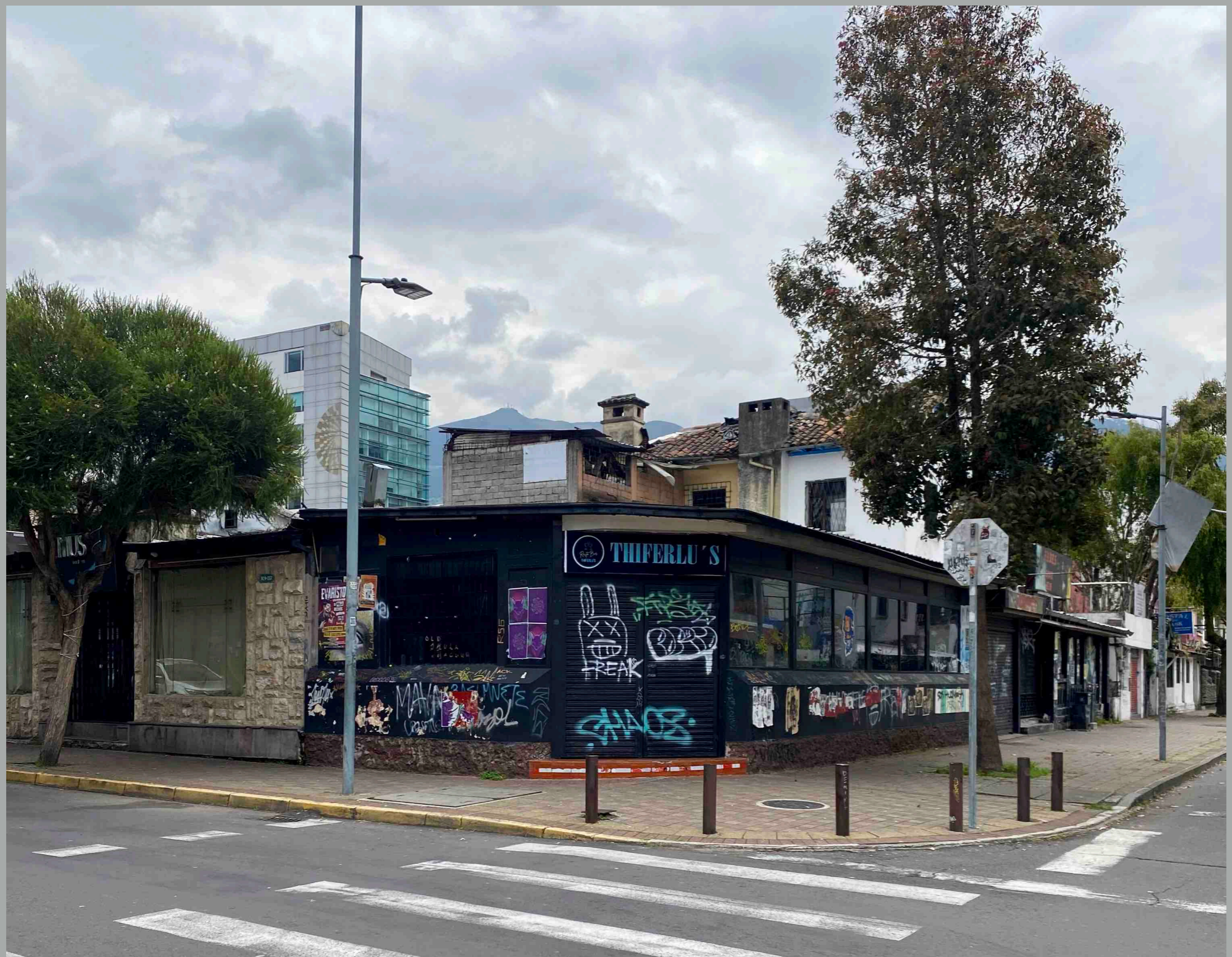
Lizardo García y Diego de Almagro