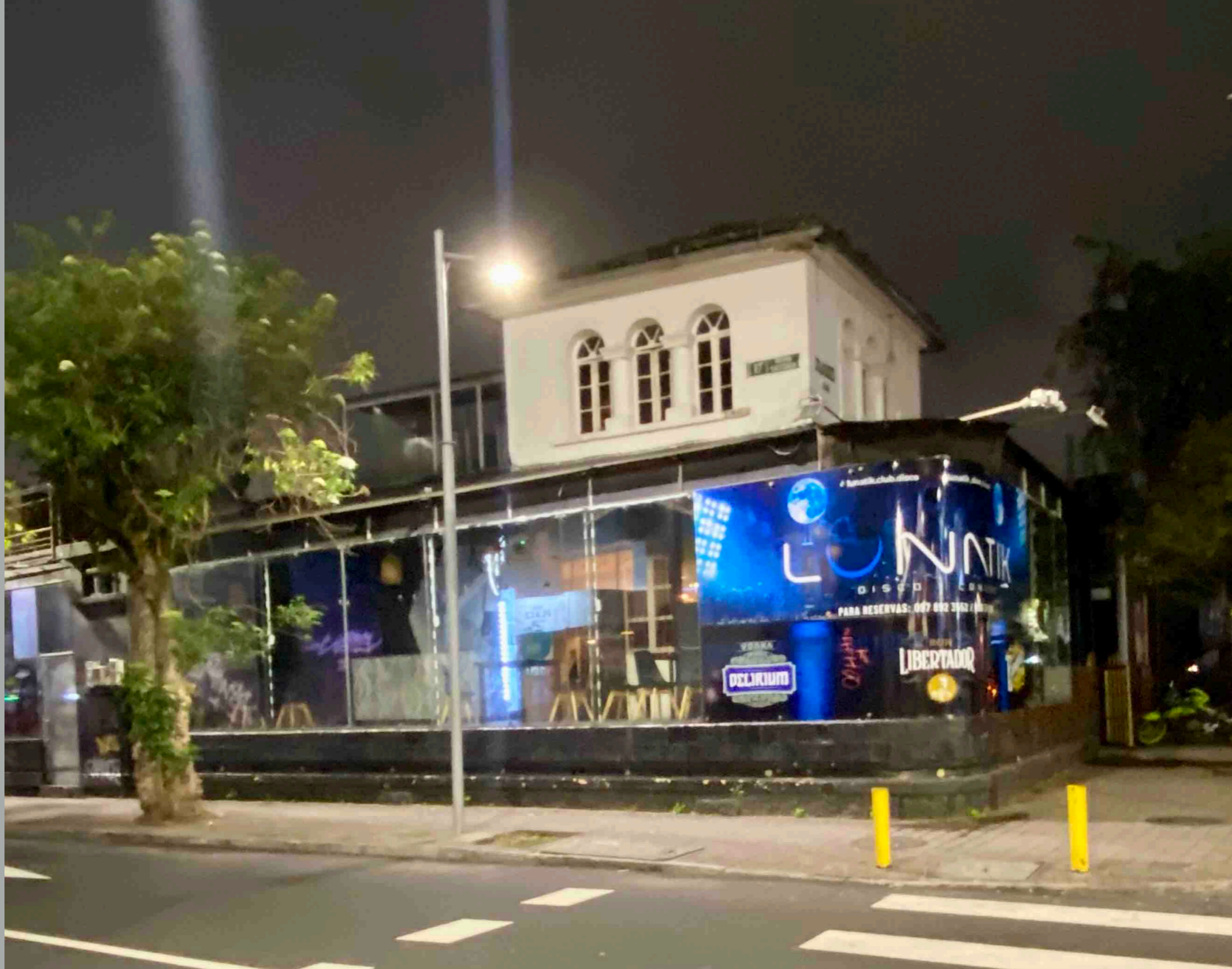
Calama y Reina Victoria (Antigua Boca del Lobo)