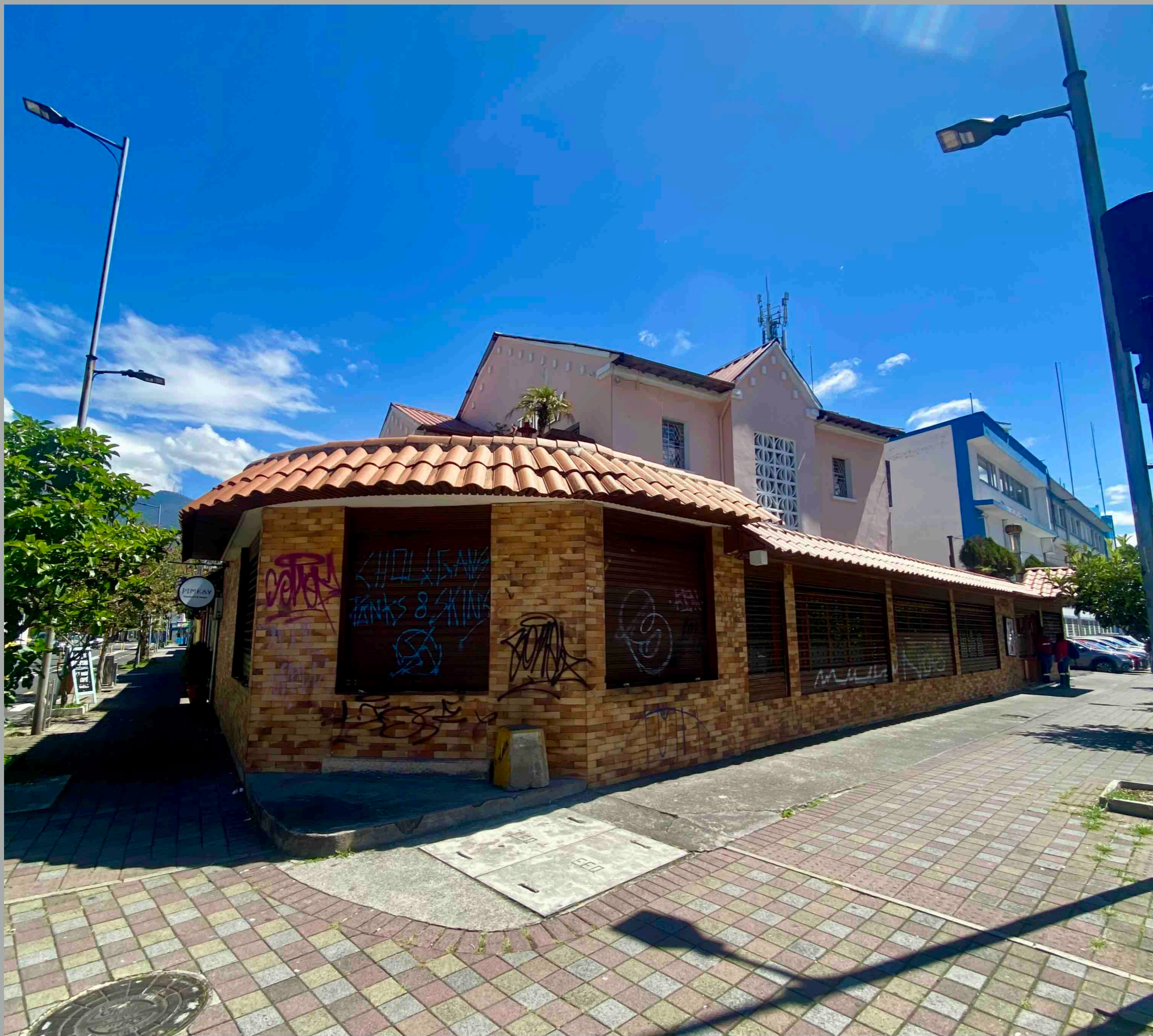
Reina Victoria y Carrión -El Árabe (más de 25 años)-