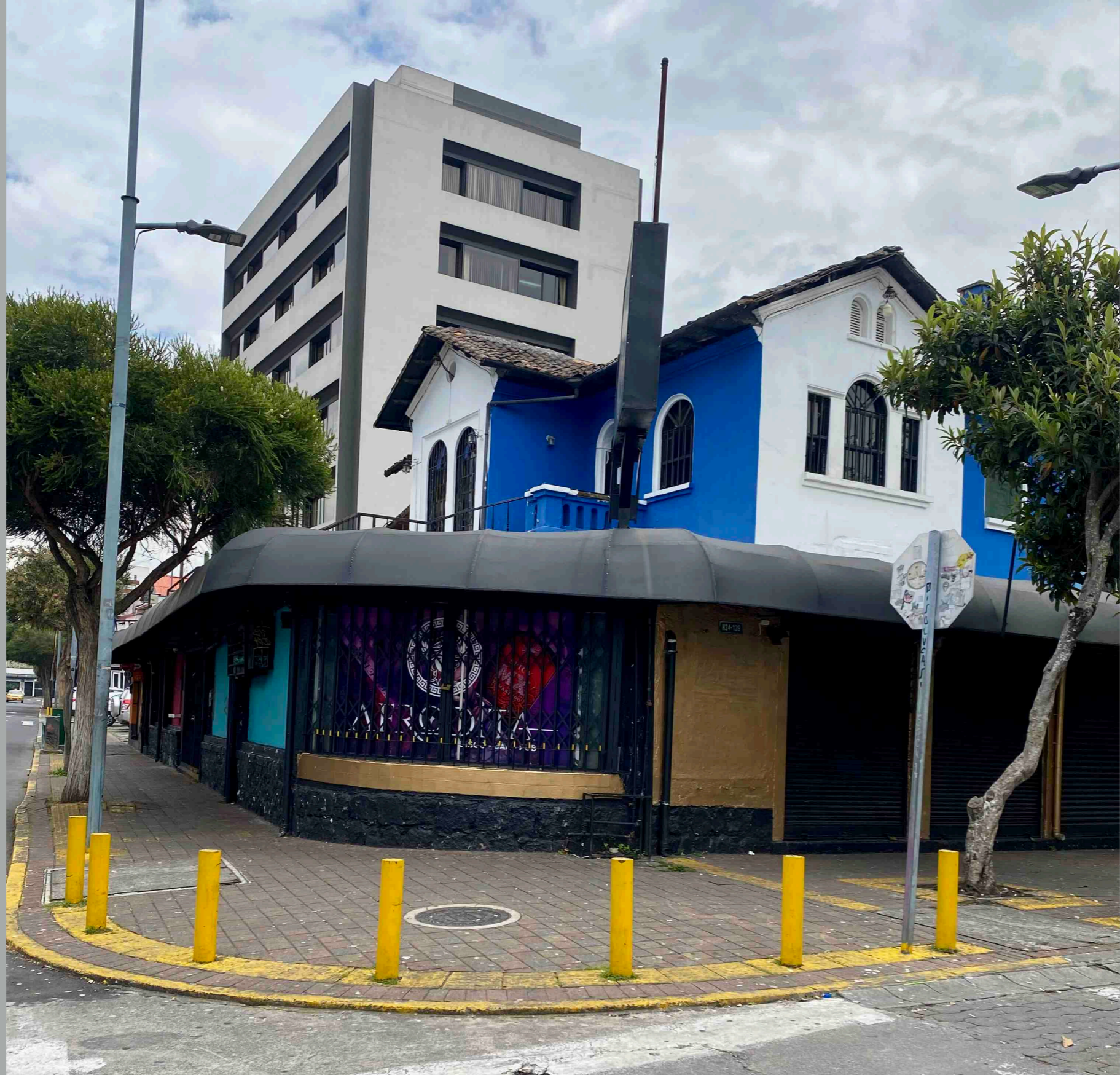
Diego de Almagro y Calama