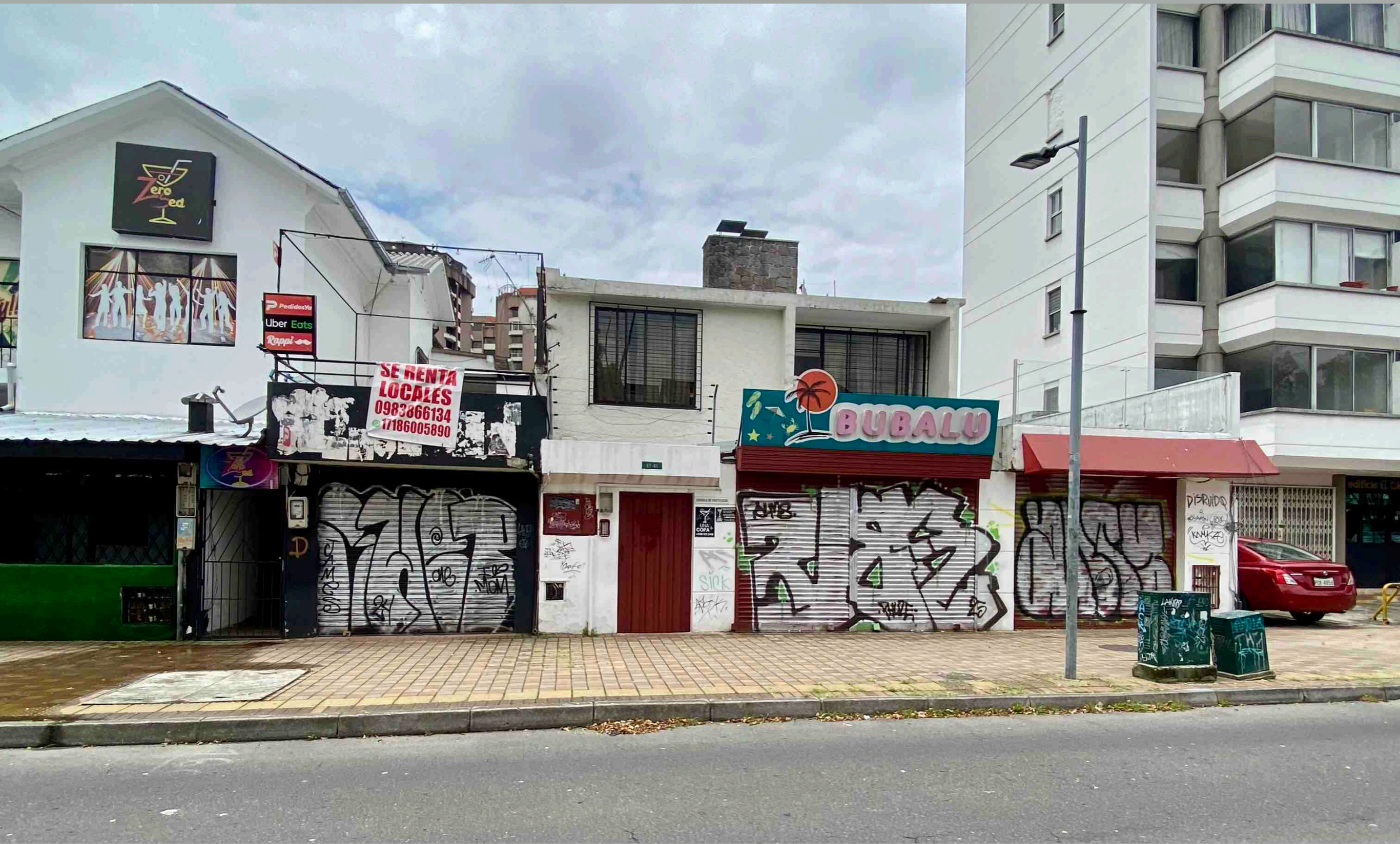
Lizardo García y Diego de Almagro