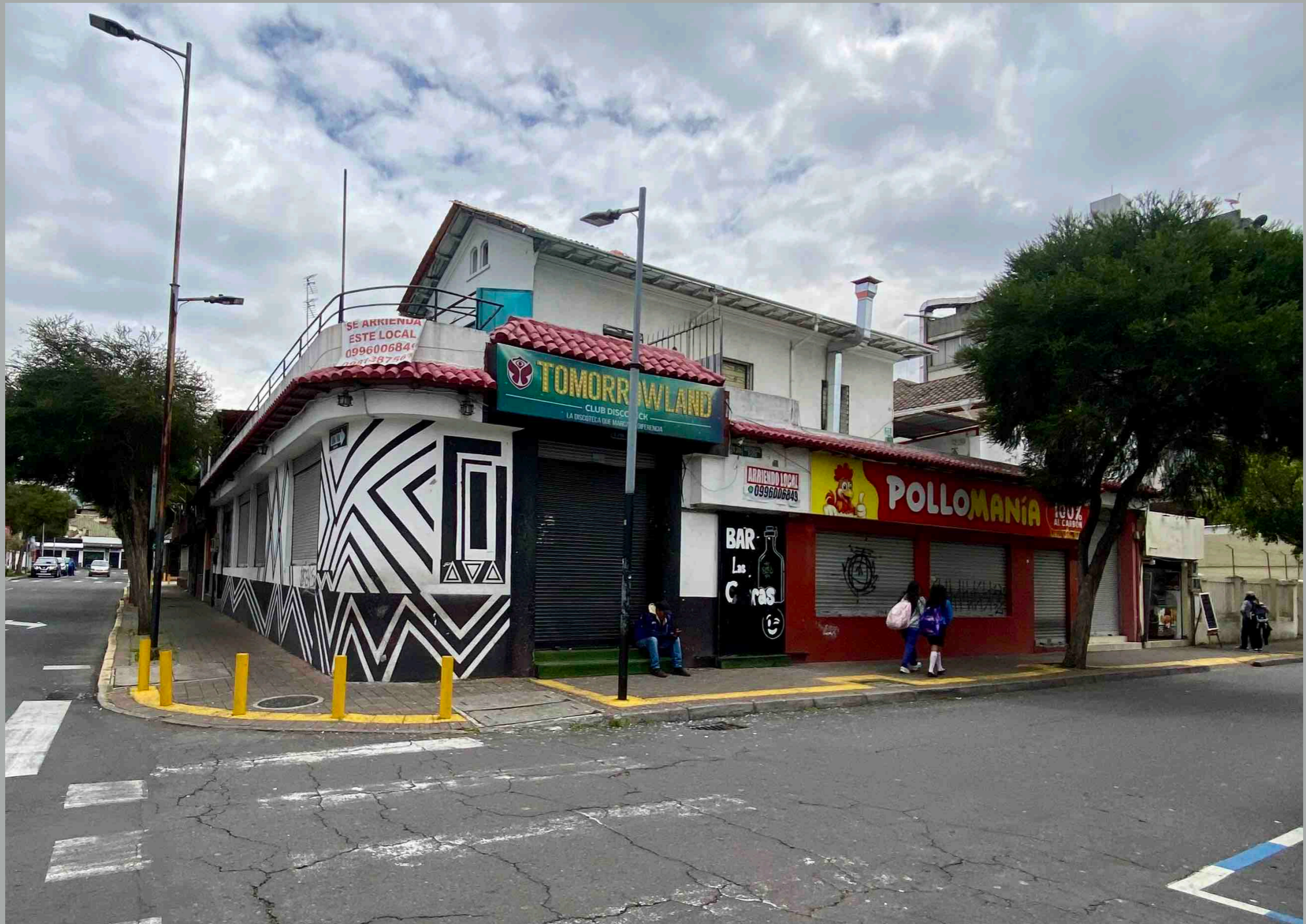
Diego de Almagro y Foch