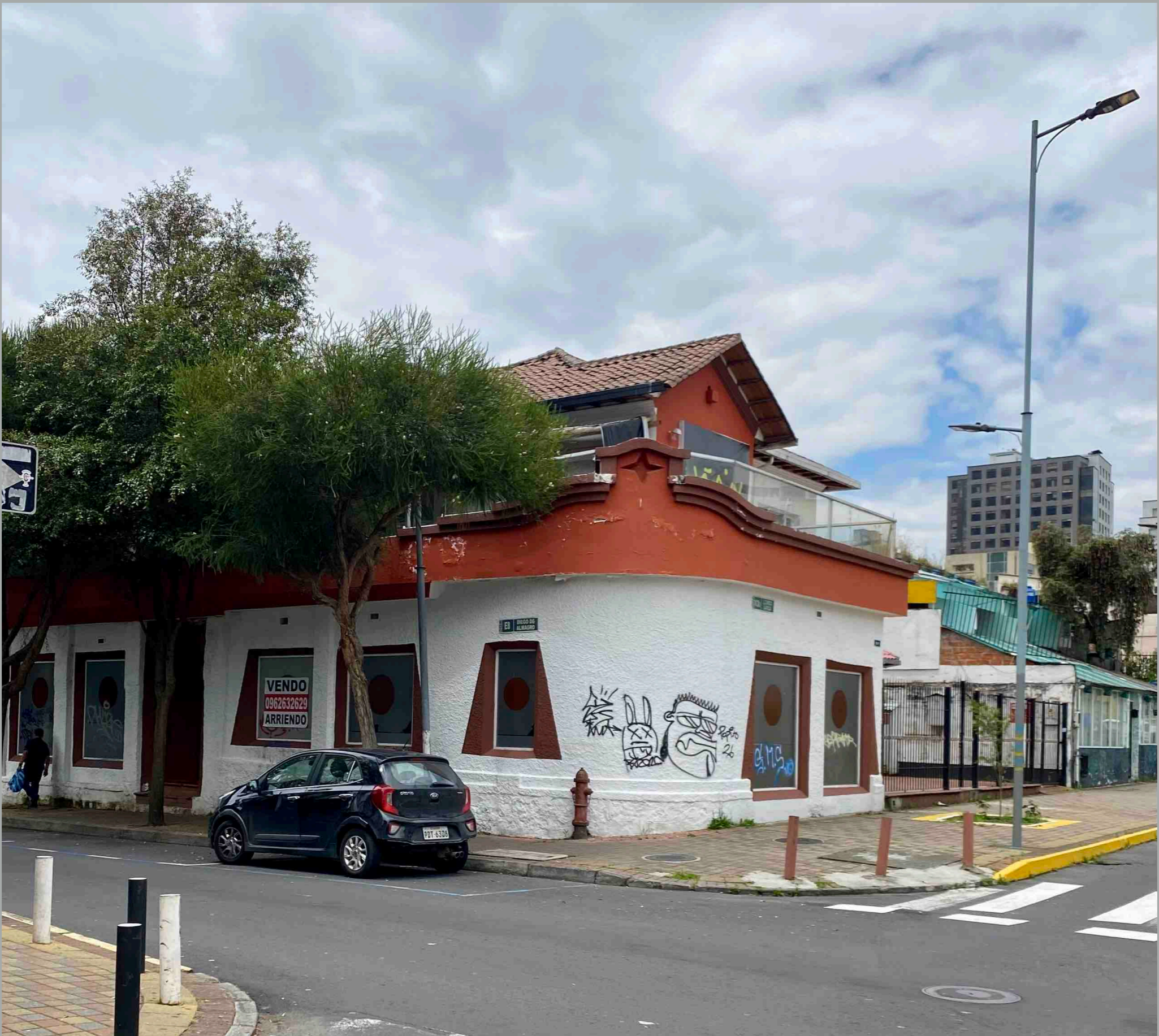
Lizardo García y Diego de Almagro