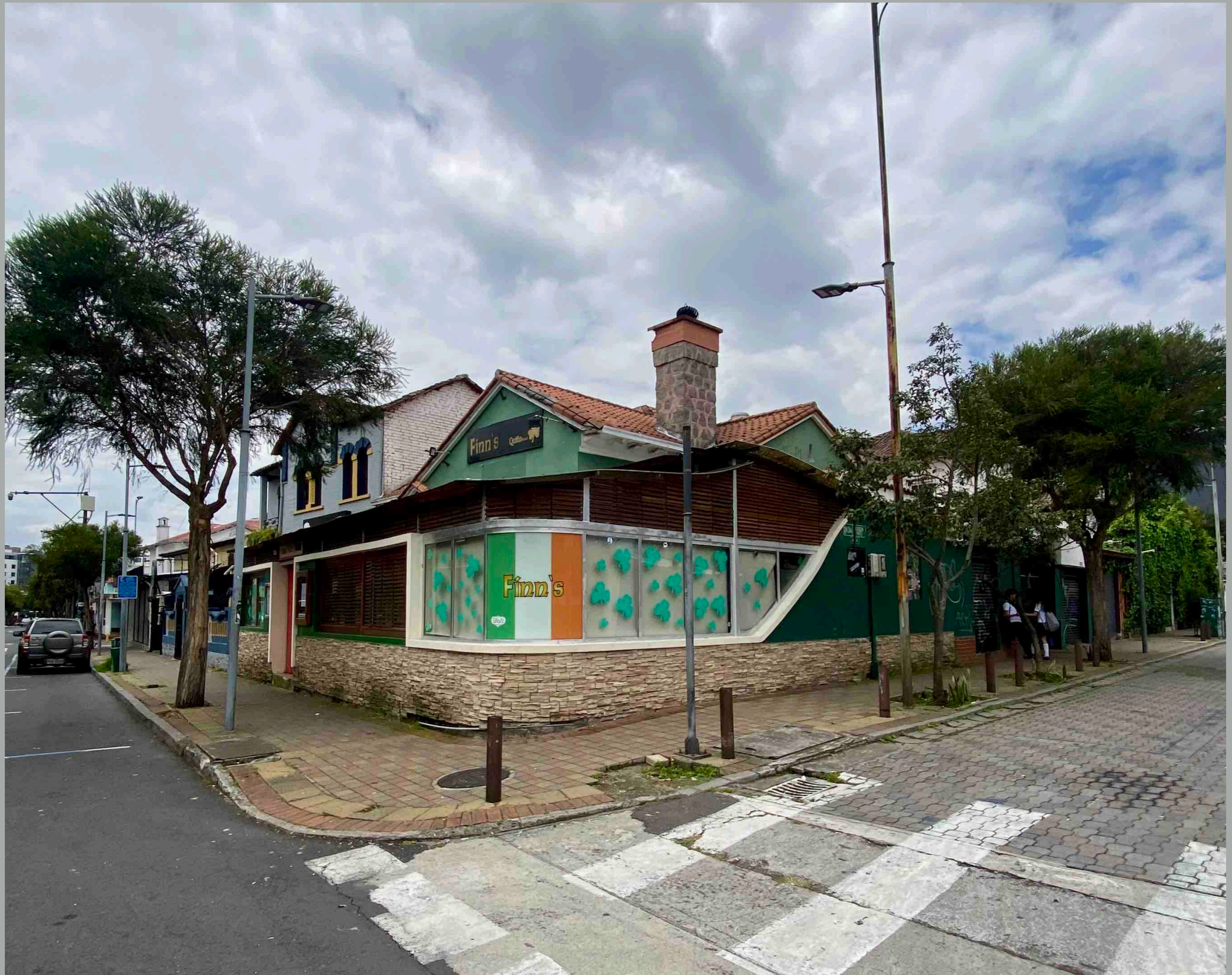
Diego de Almagro y Joaquín Pinto