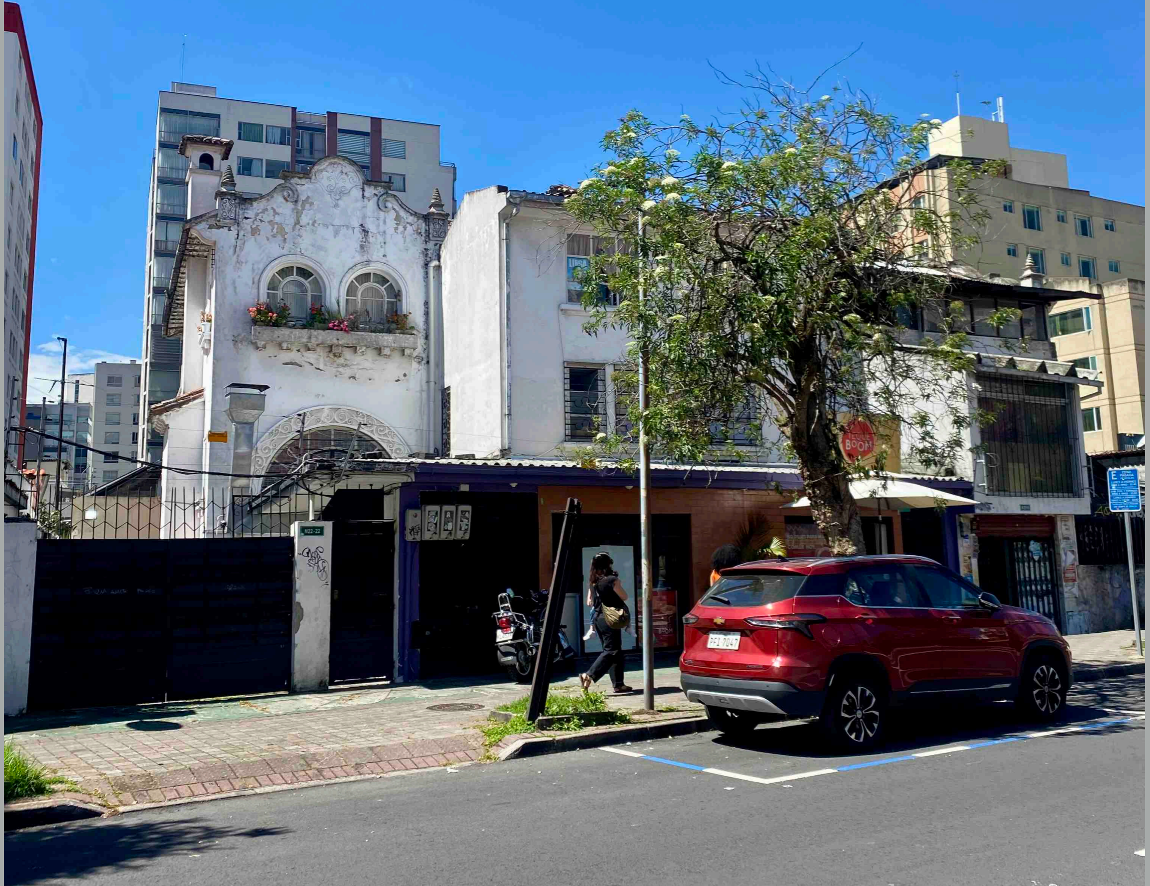
Reina Victoria e/ Veintimilla y Carrión