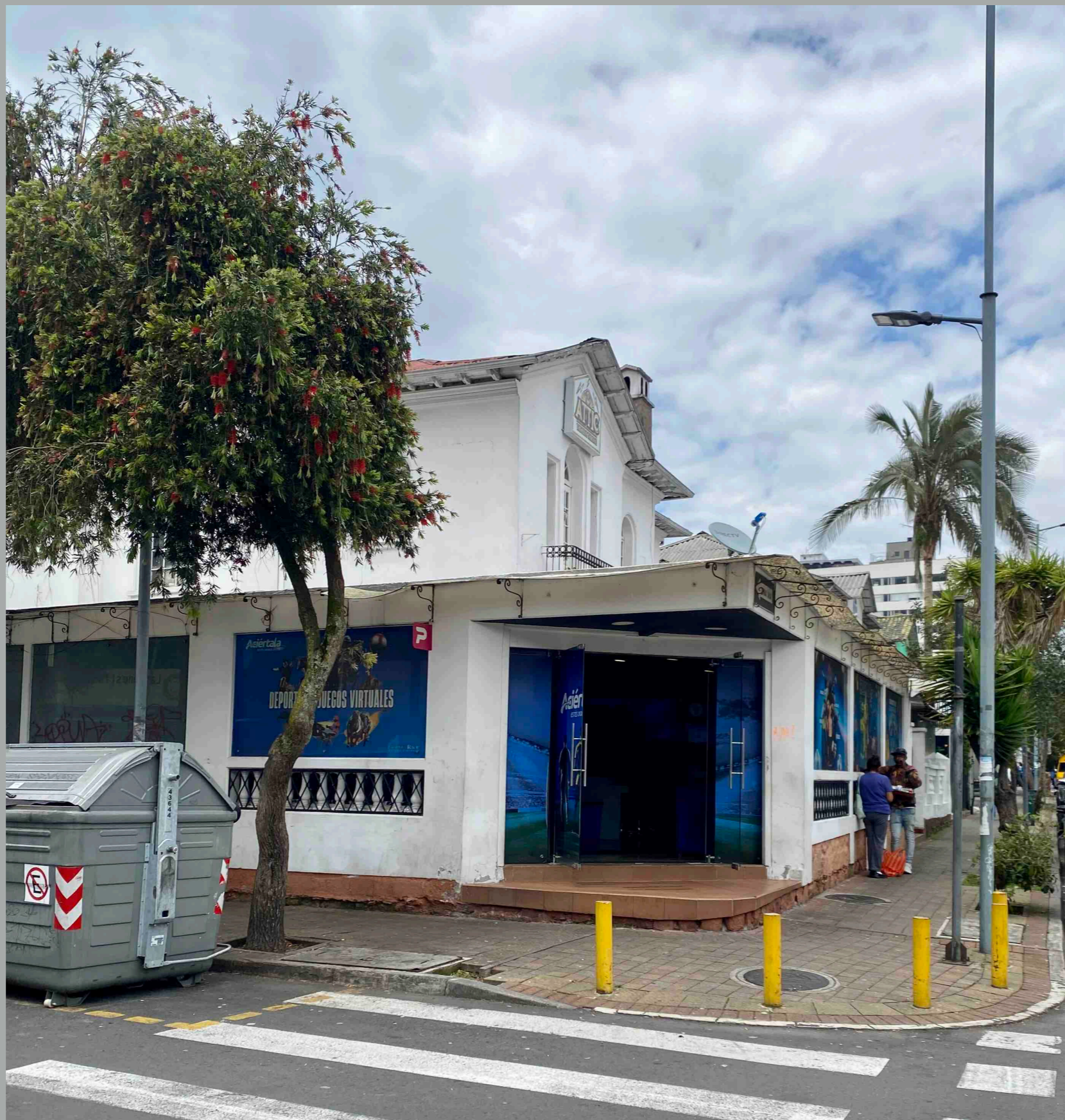
Lizardo García y Diego de Almagro