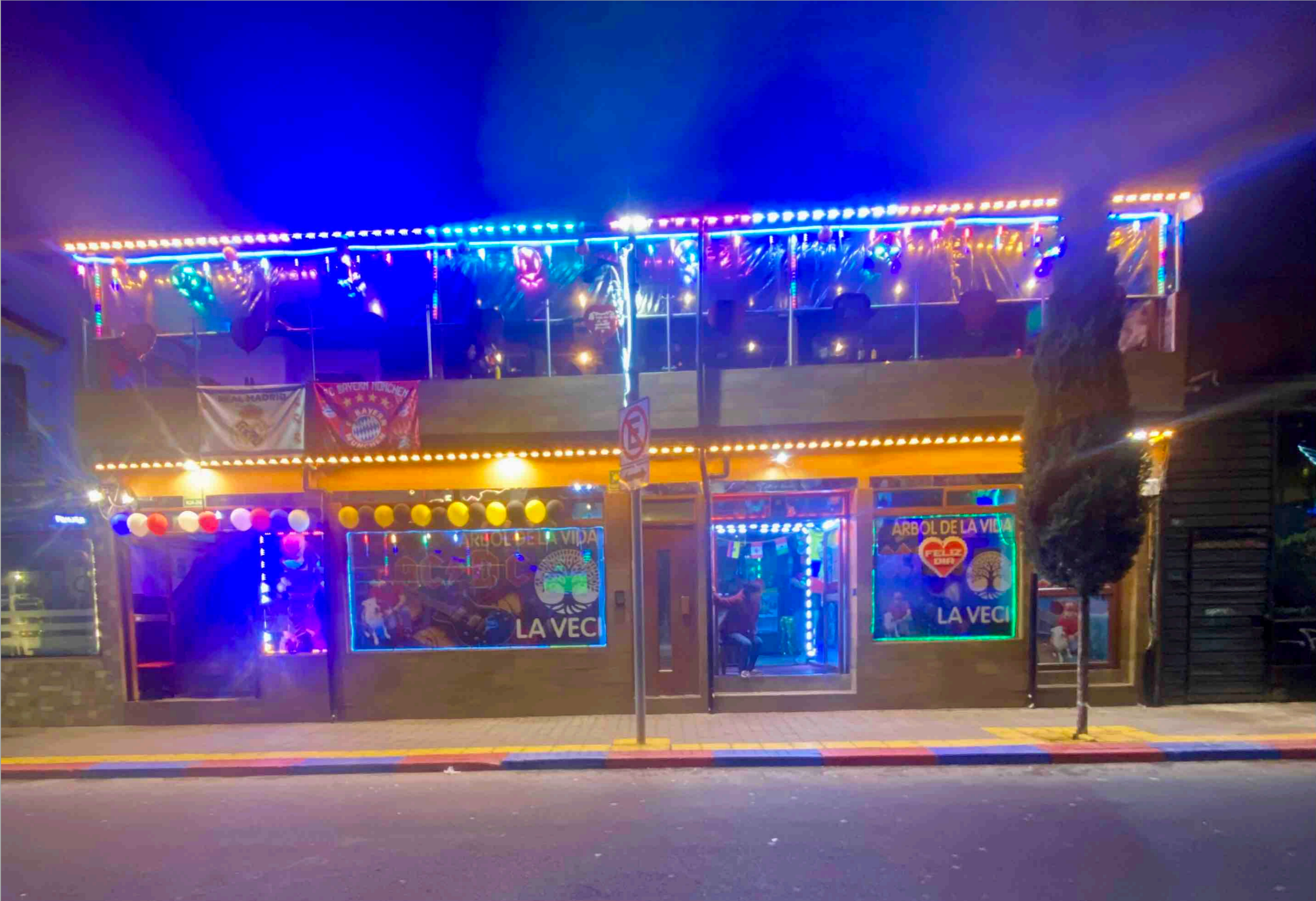
Reina Victoria e/Lizardo Garcia y Calama