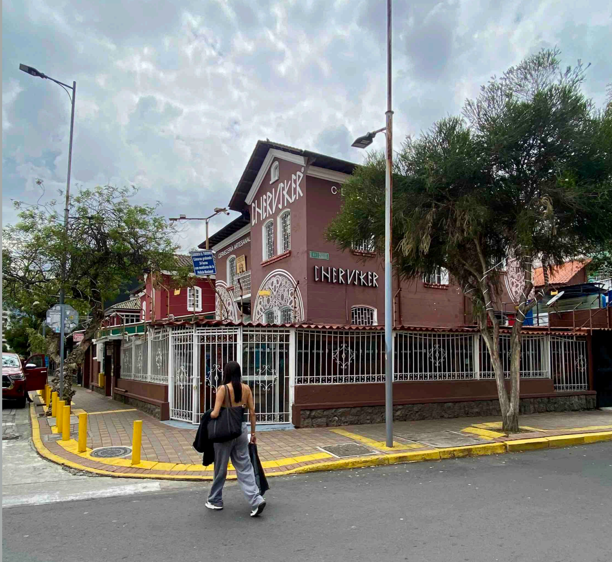
Joaquín Pinto y Diego de Almagro