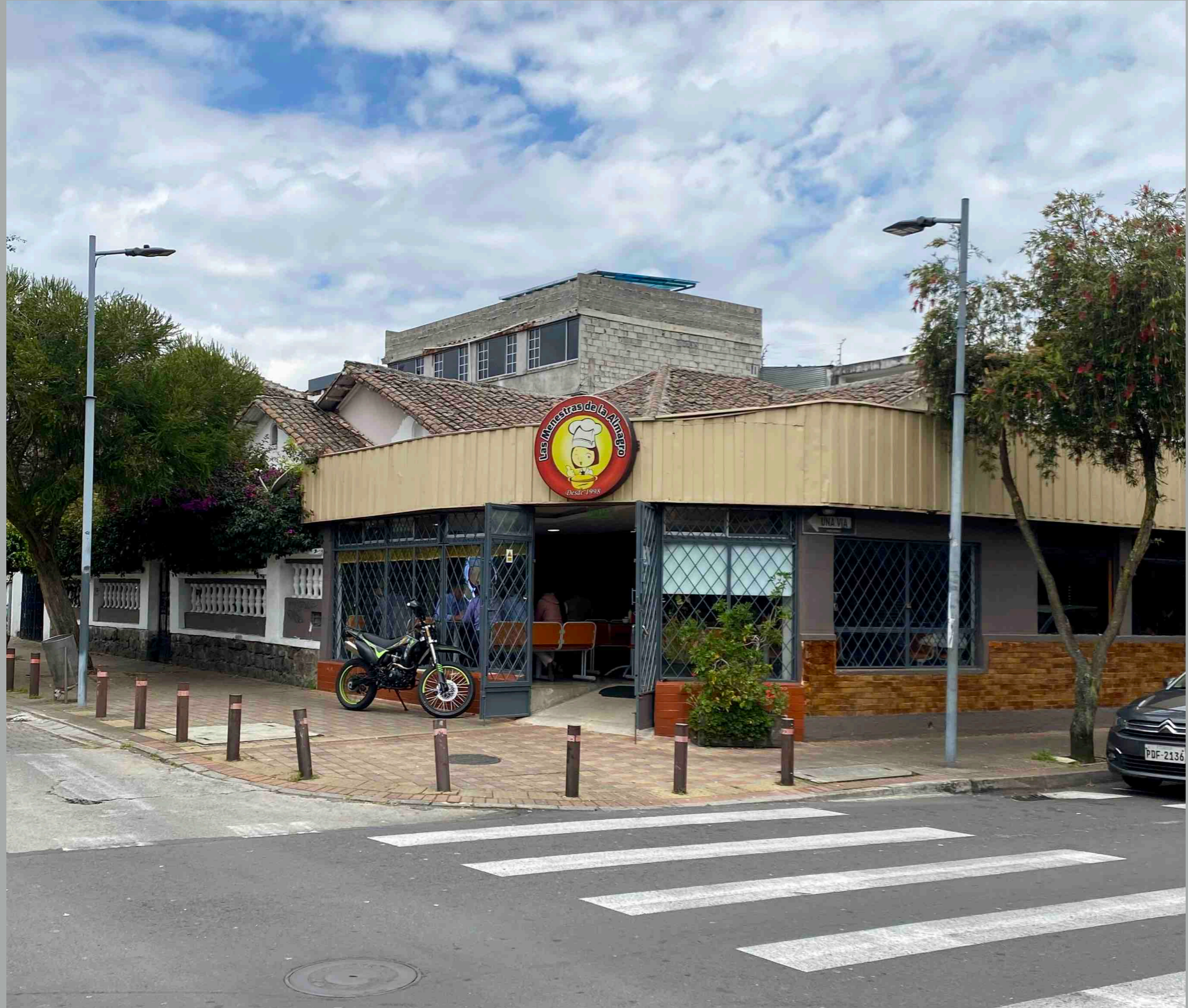
Diego de Almagro y Calama