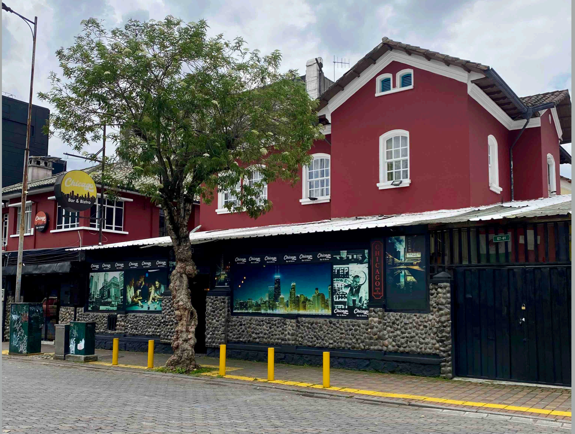
Joaquín Pinto y Diego de Almagro