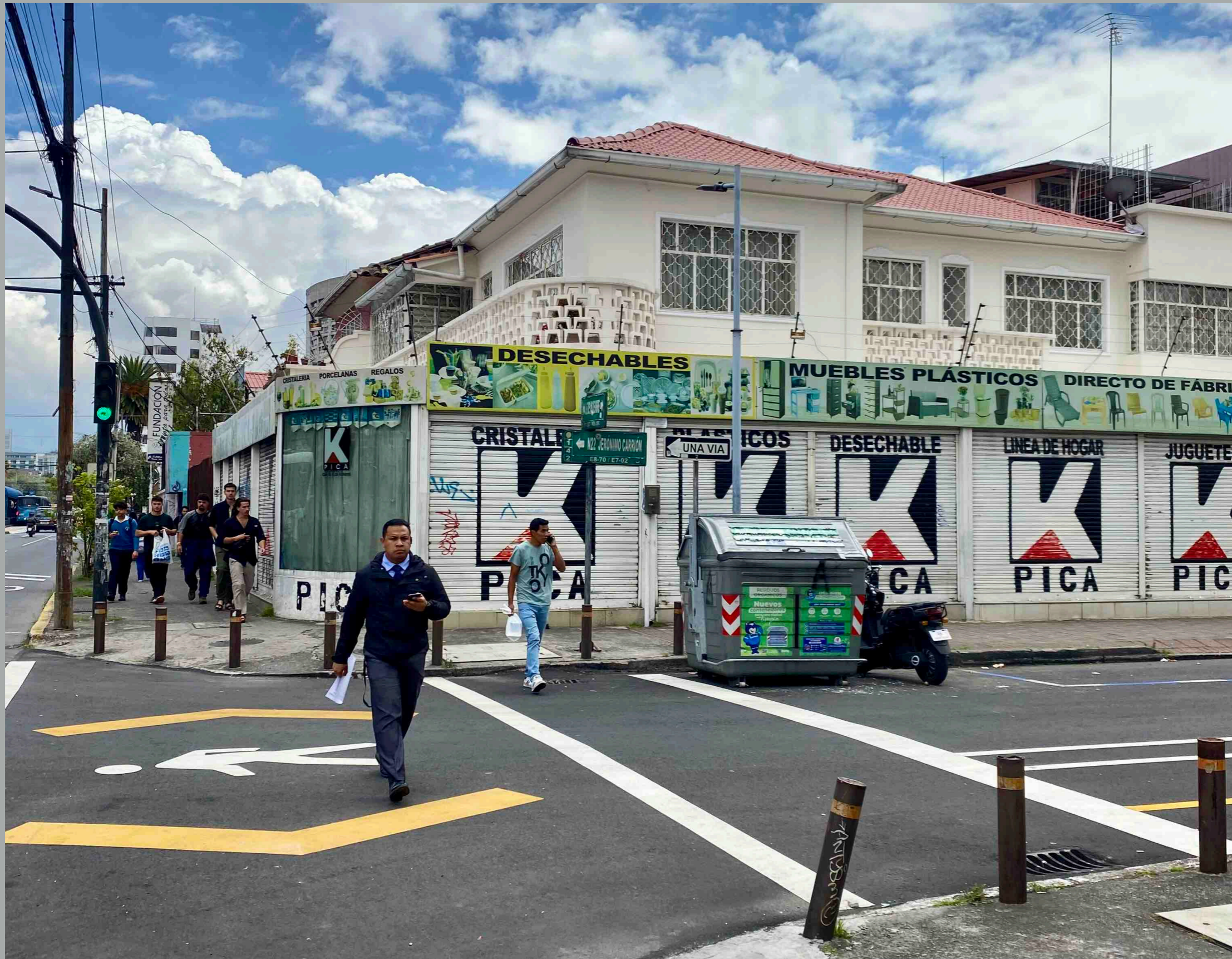
6 de diciembre y Carrión -PICA-