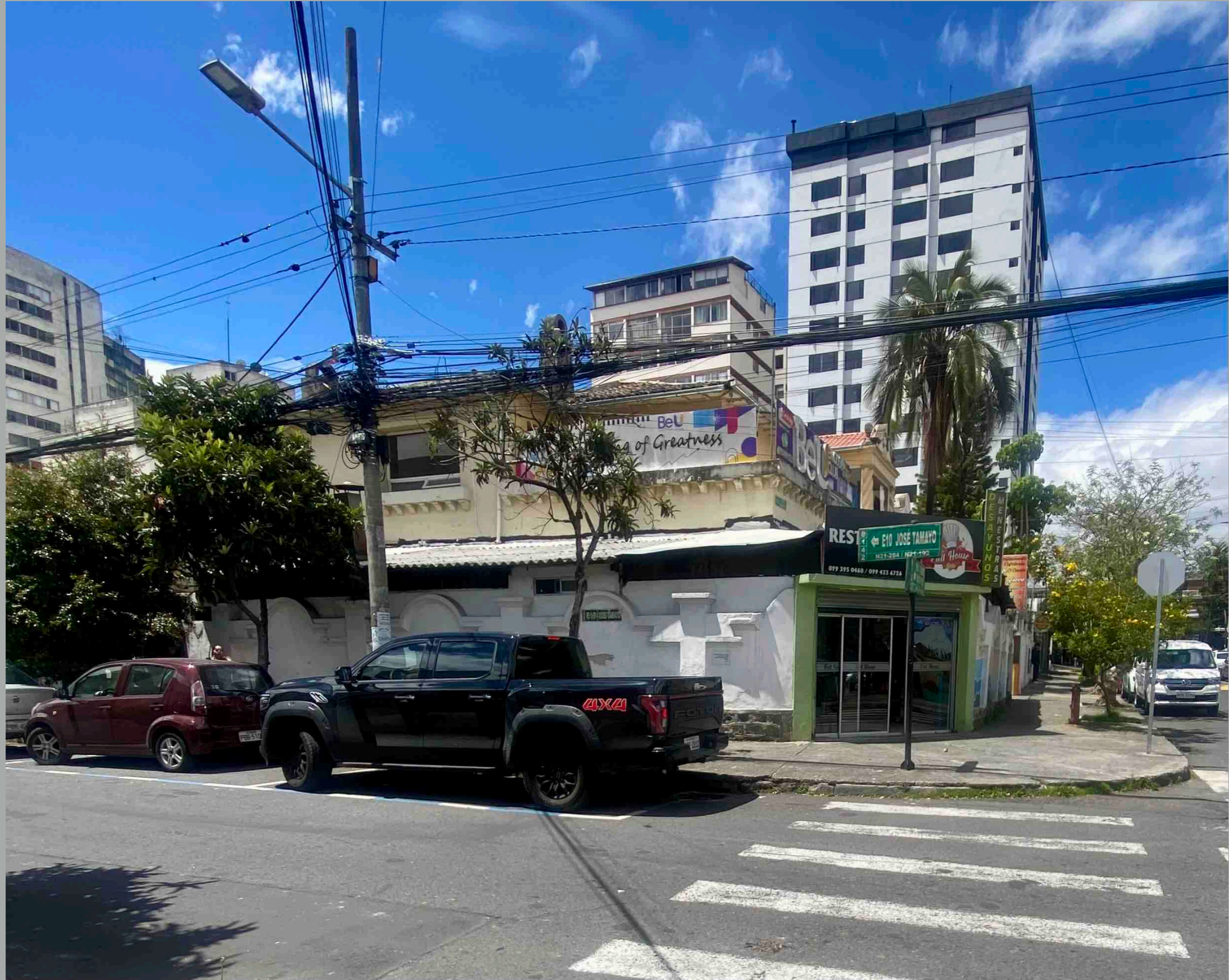
Roca y Tamayo