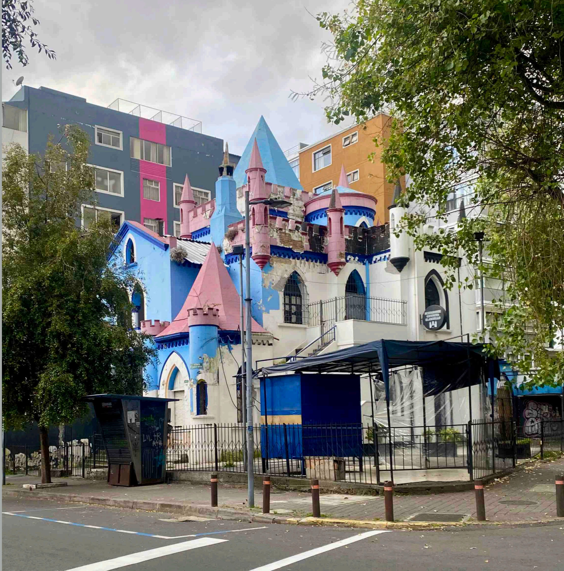
Juan León Mera y Roca