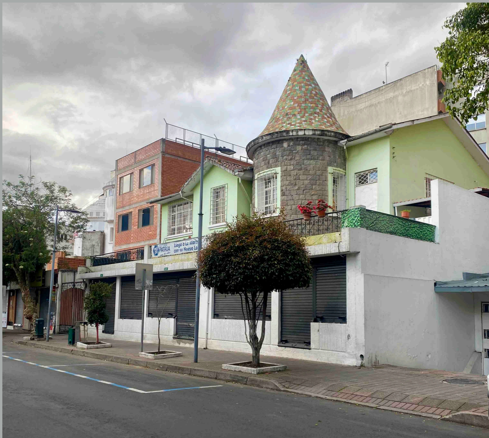
Roca y Reina Victoria