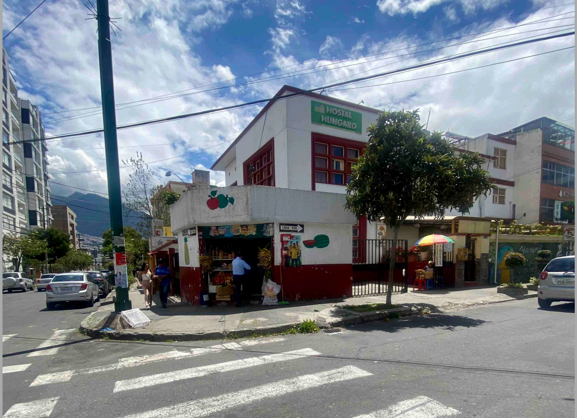
Tamayo y Roca -vereda occidental-