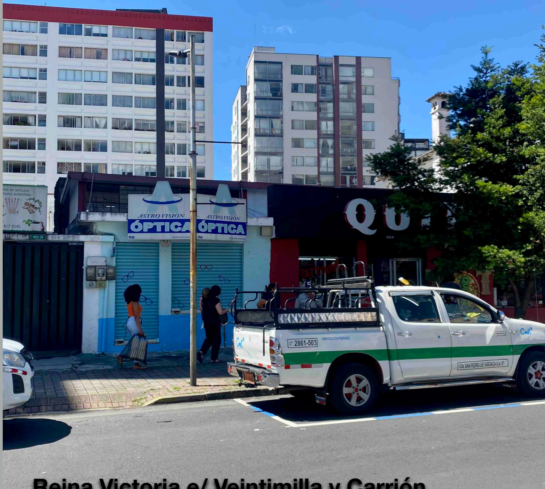
Reina Victoria e/ Veintimilla y Carrión -Casa familia Pallares '60 piscina interior, racionalista-