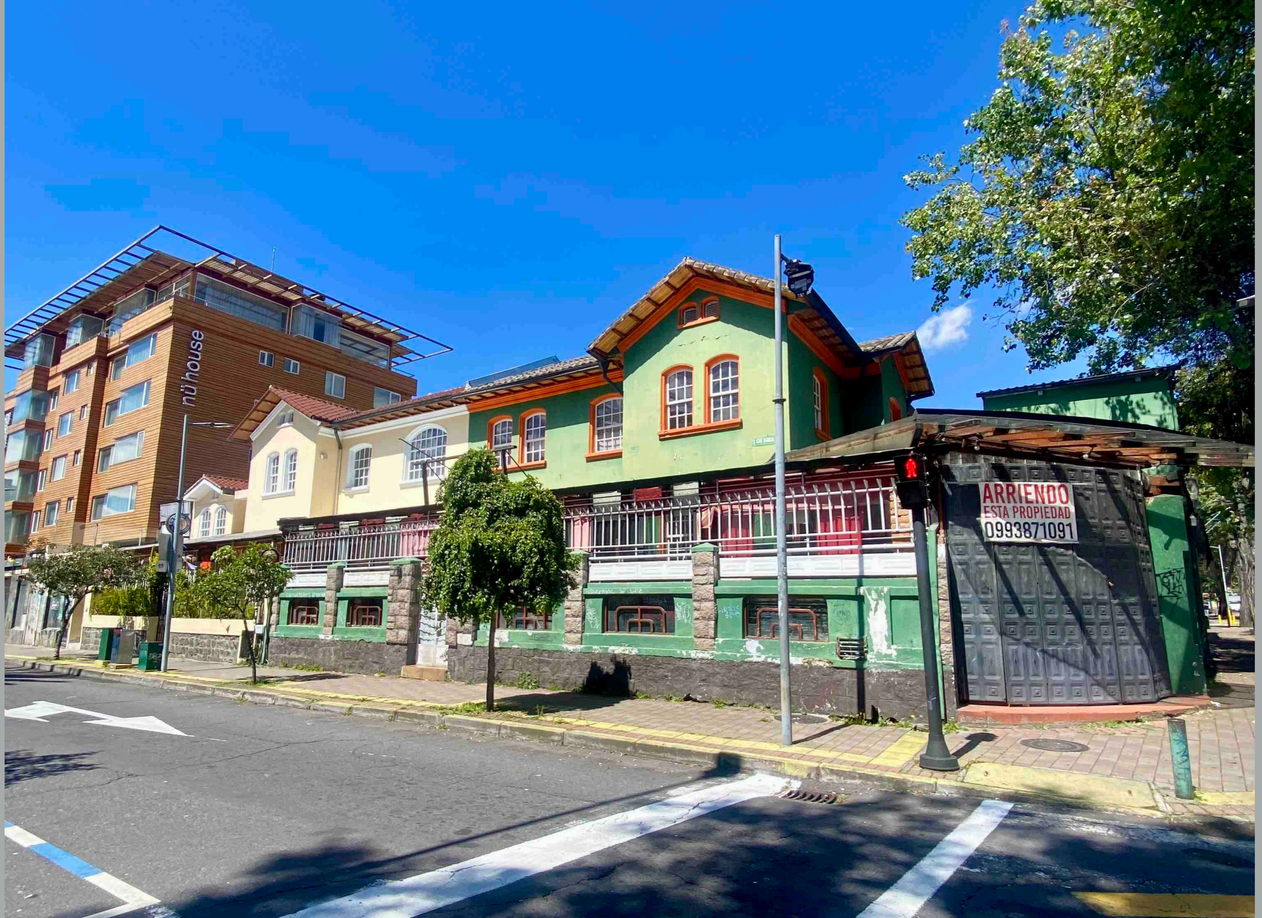
Foch y Juan León Mera