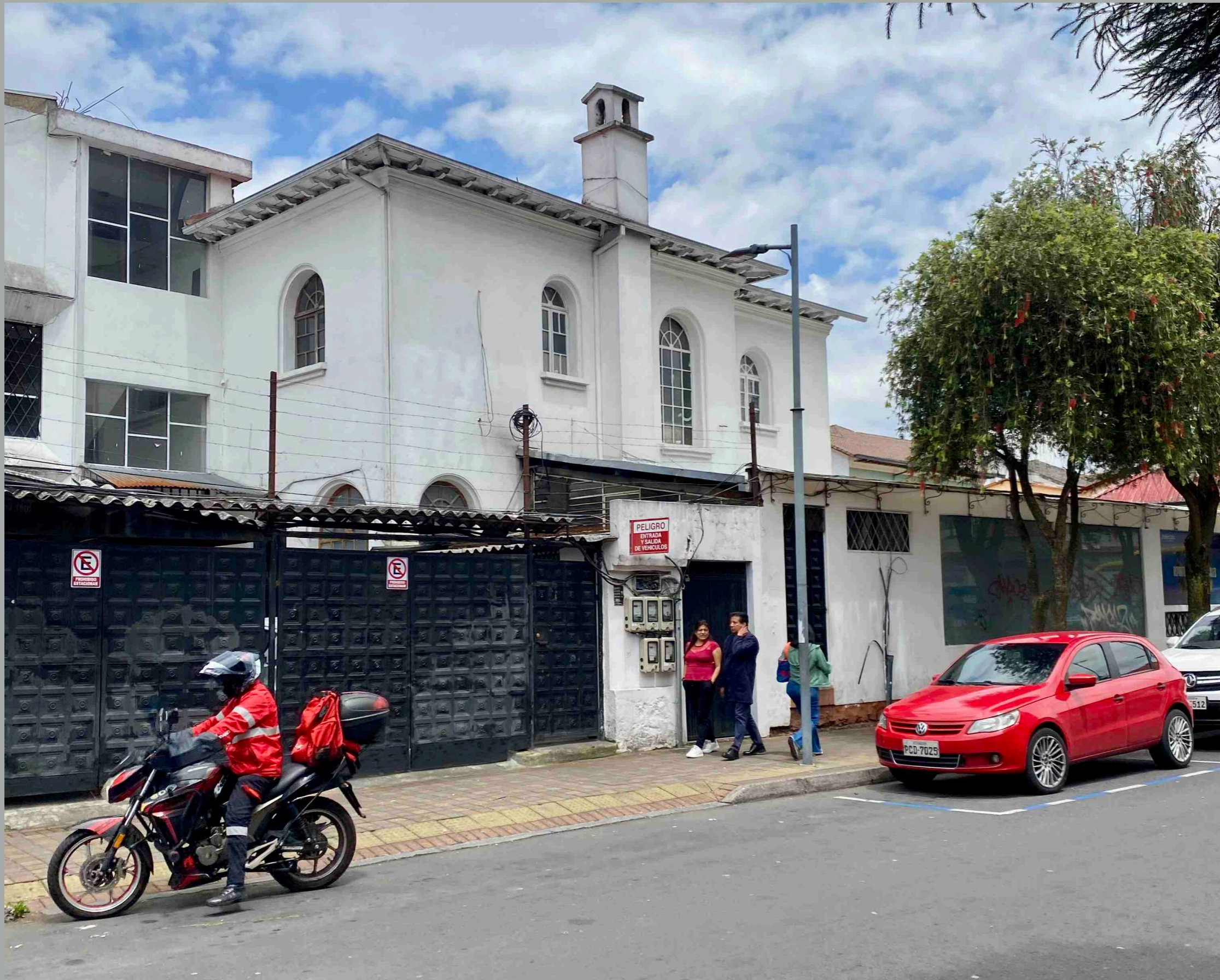
Diego de Almagro