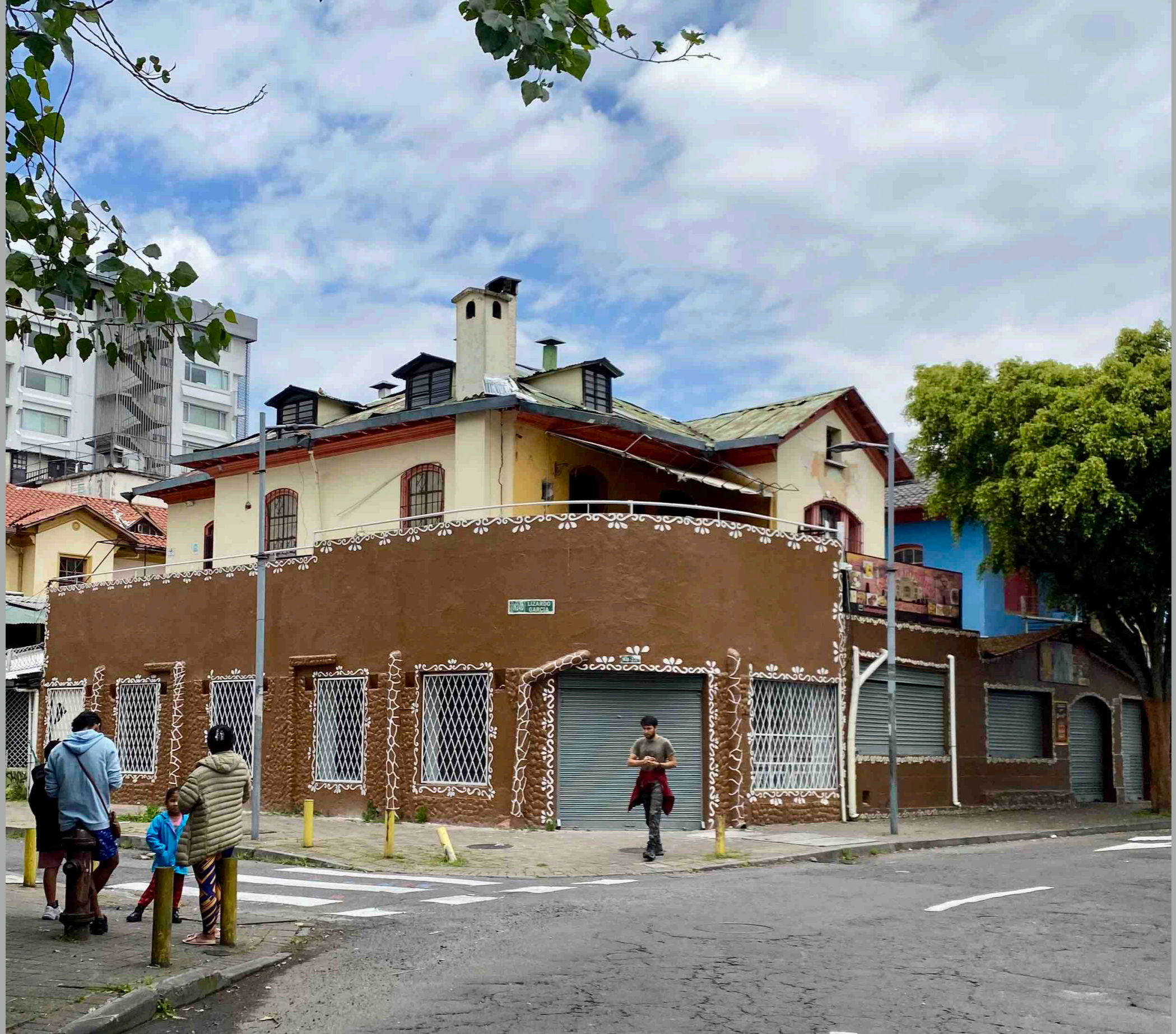
Juan León Mera y Lizardo García