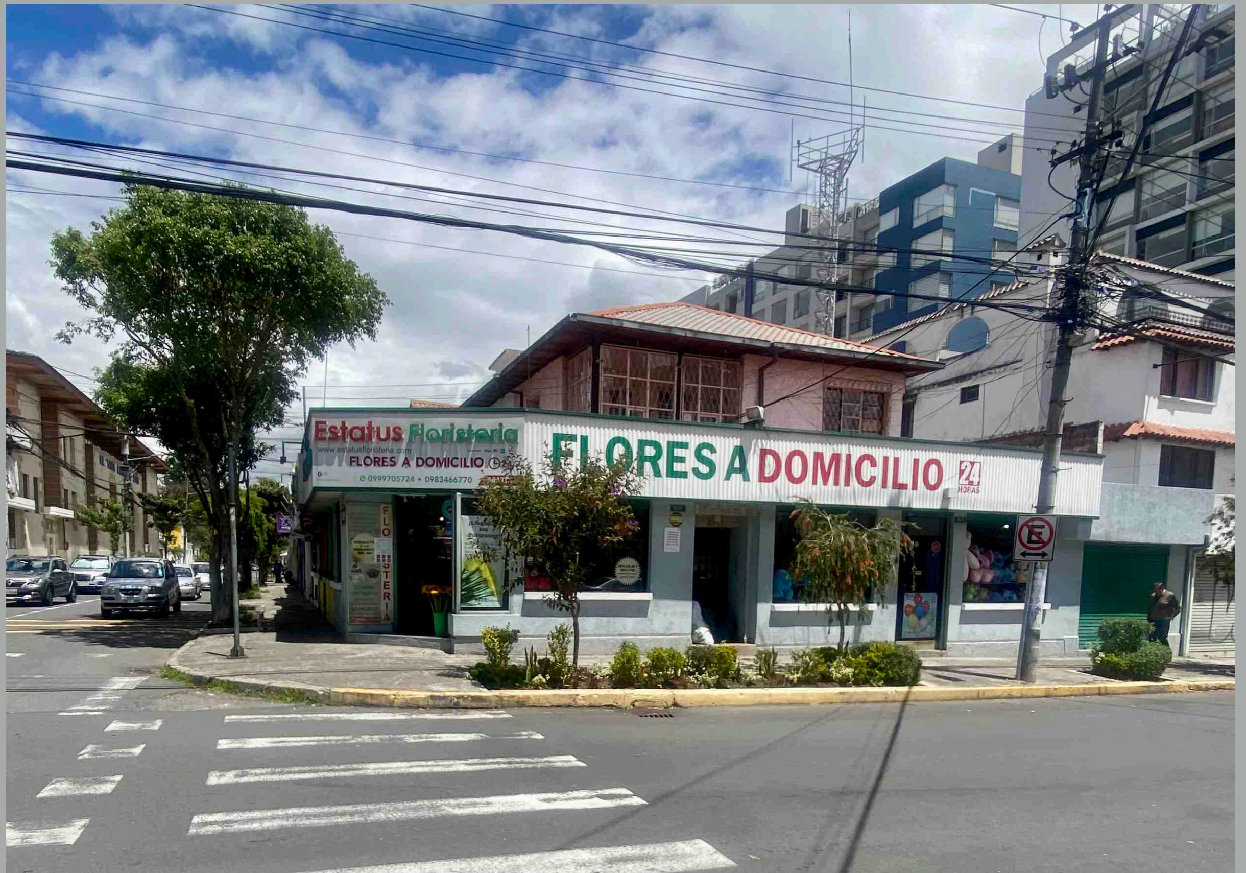
Roca y Tamayo