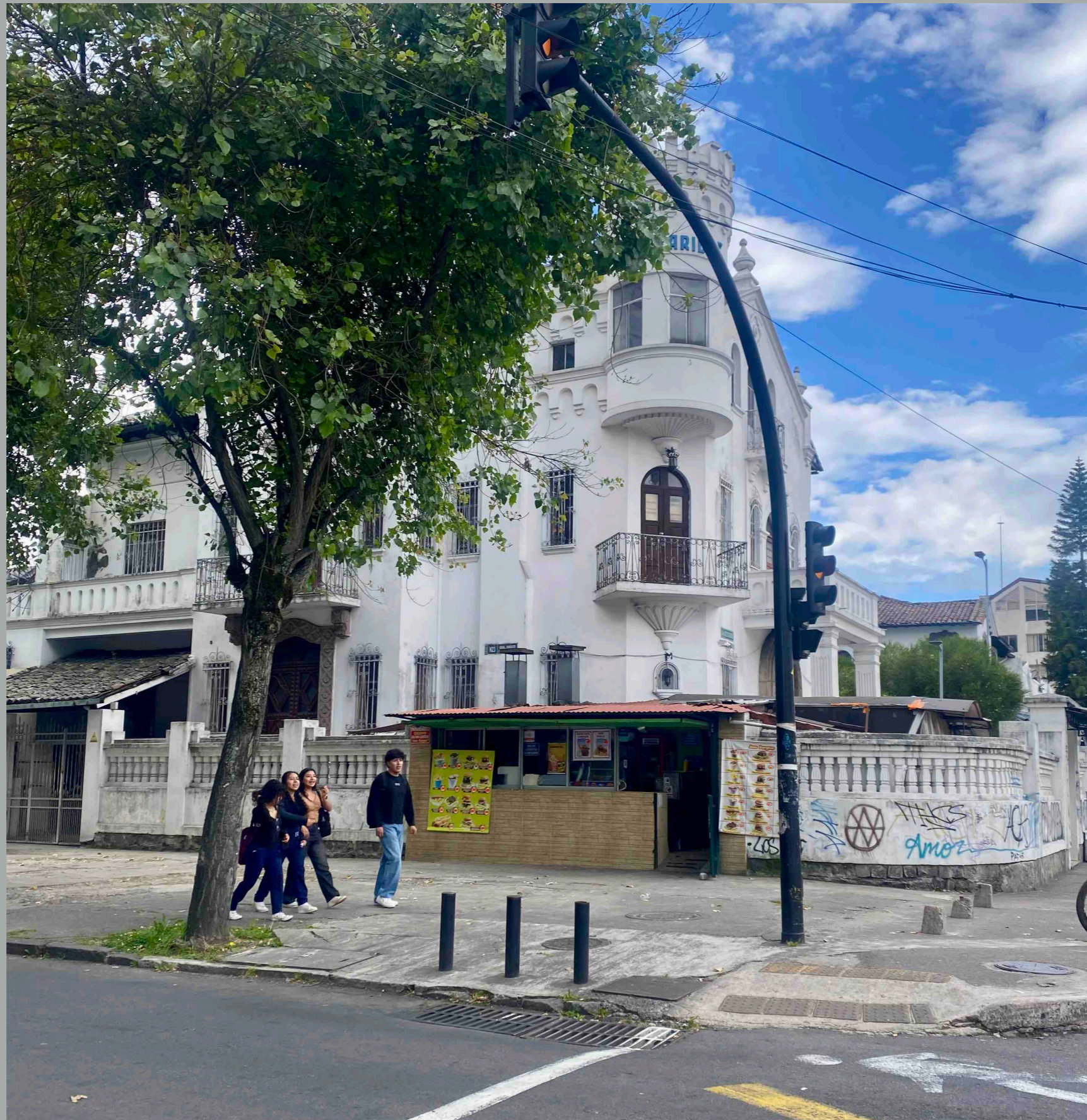
Veintimilla y 6 de diciembre