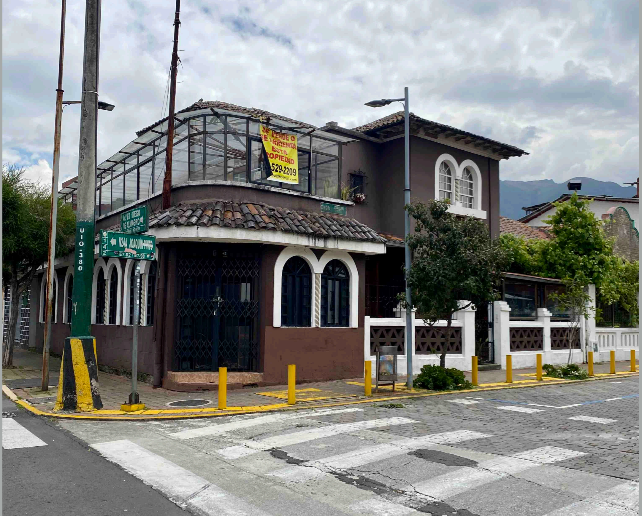
Joaquín Pinto y Diego de Almagro