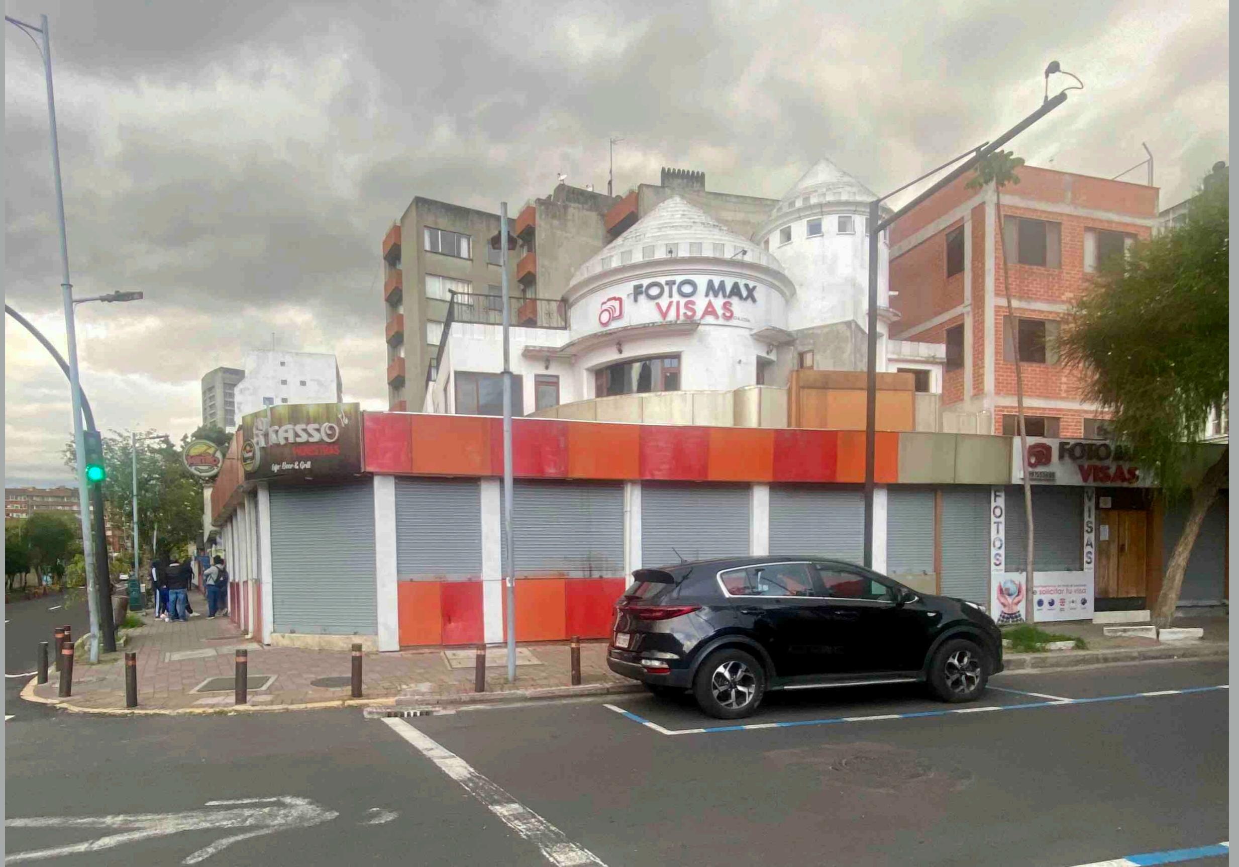
Roca y Reina Victoria