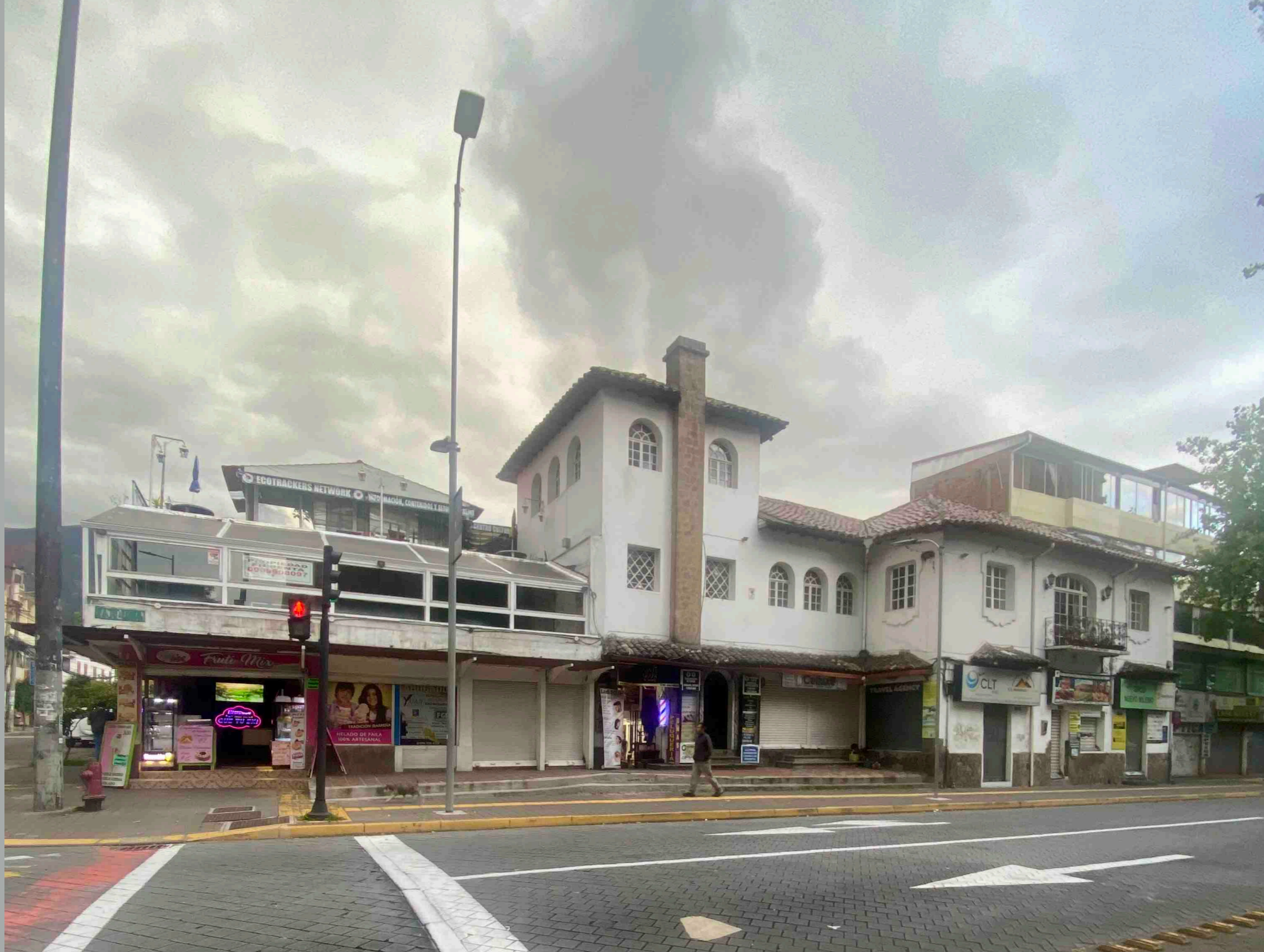
Amazonas y Roca