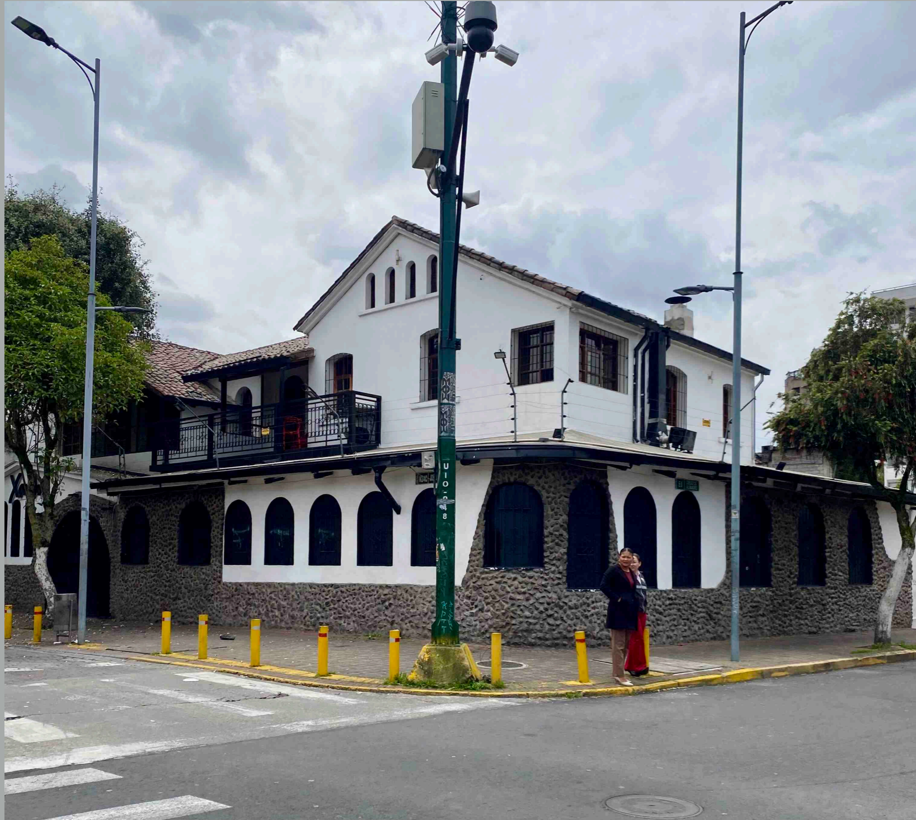
Calama y Diego de Almagro