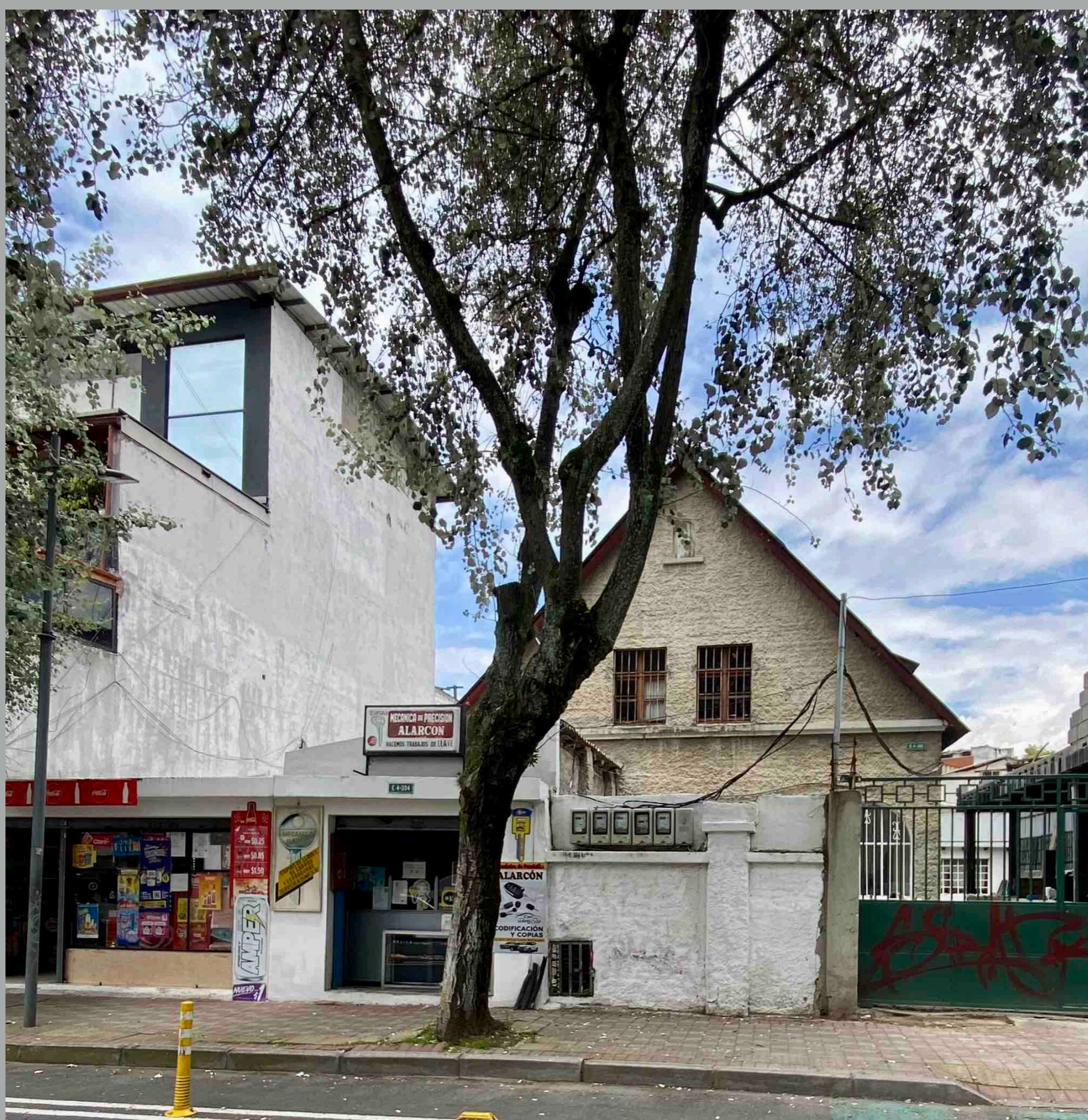
Luis Cordero y Juan León Mera