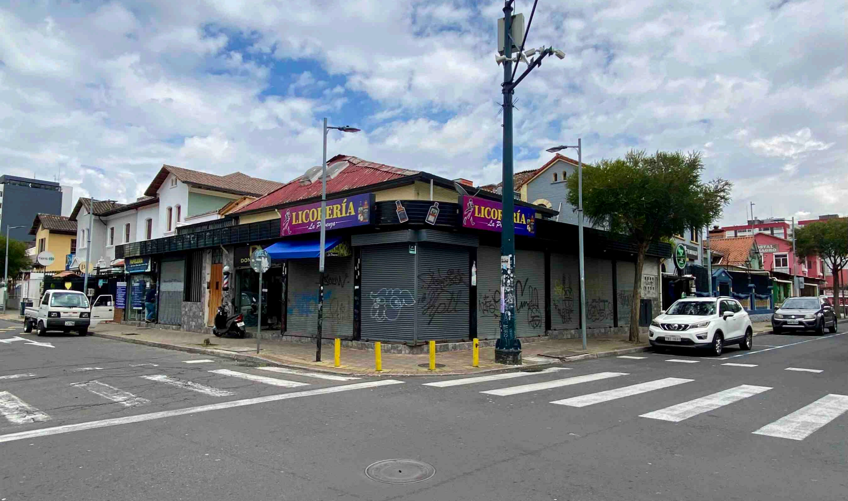
Diego de Almagro y Foch