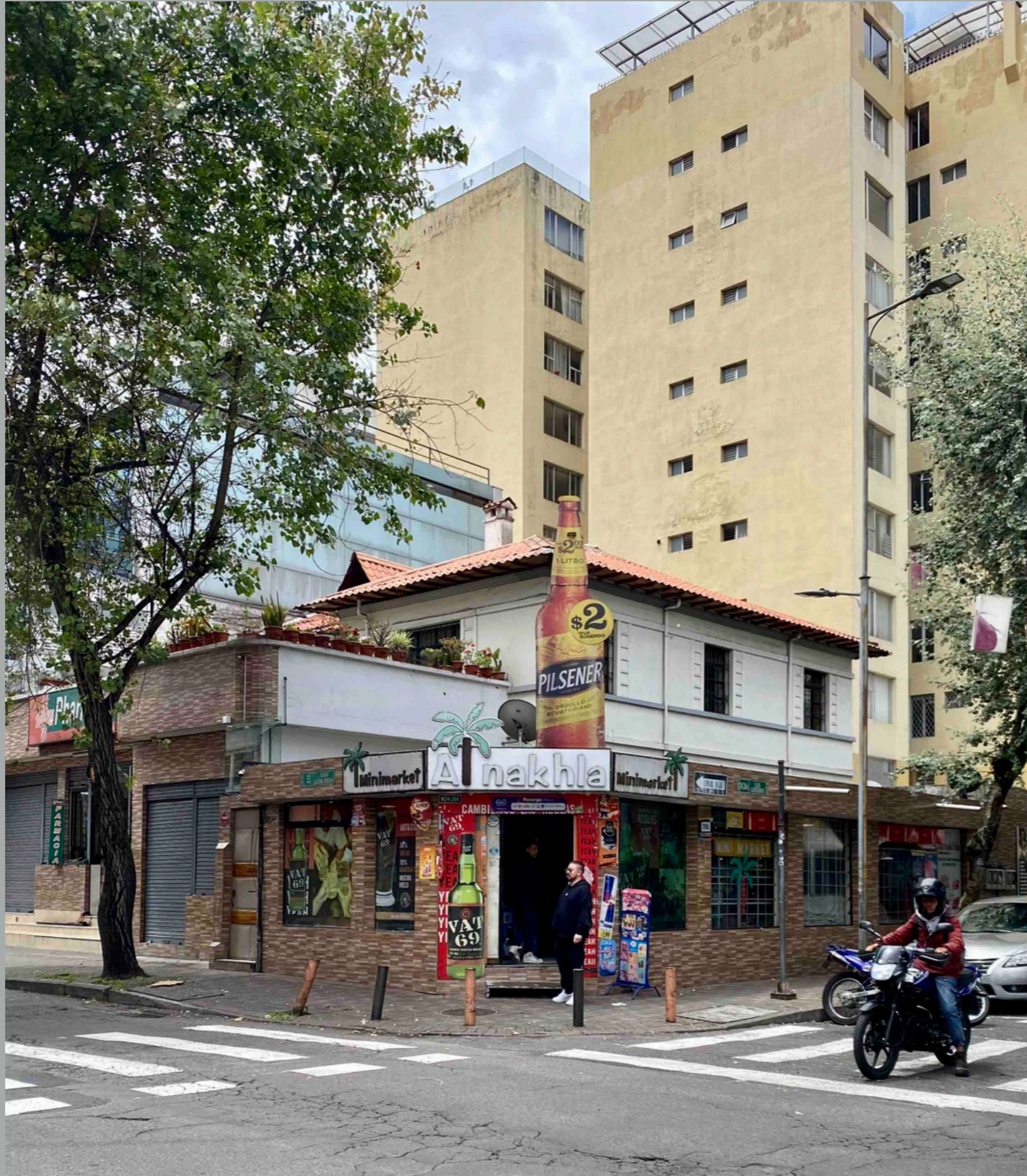
Luis Cordero y Juan León Mera