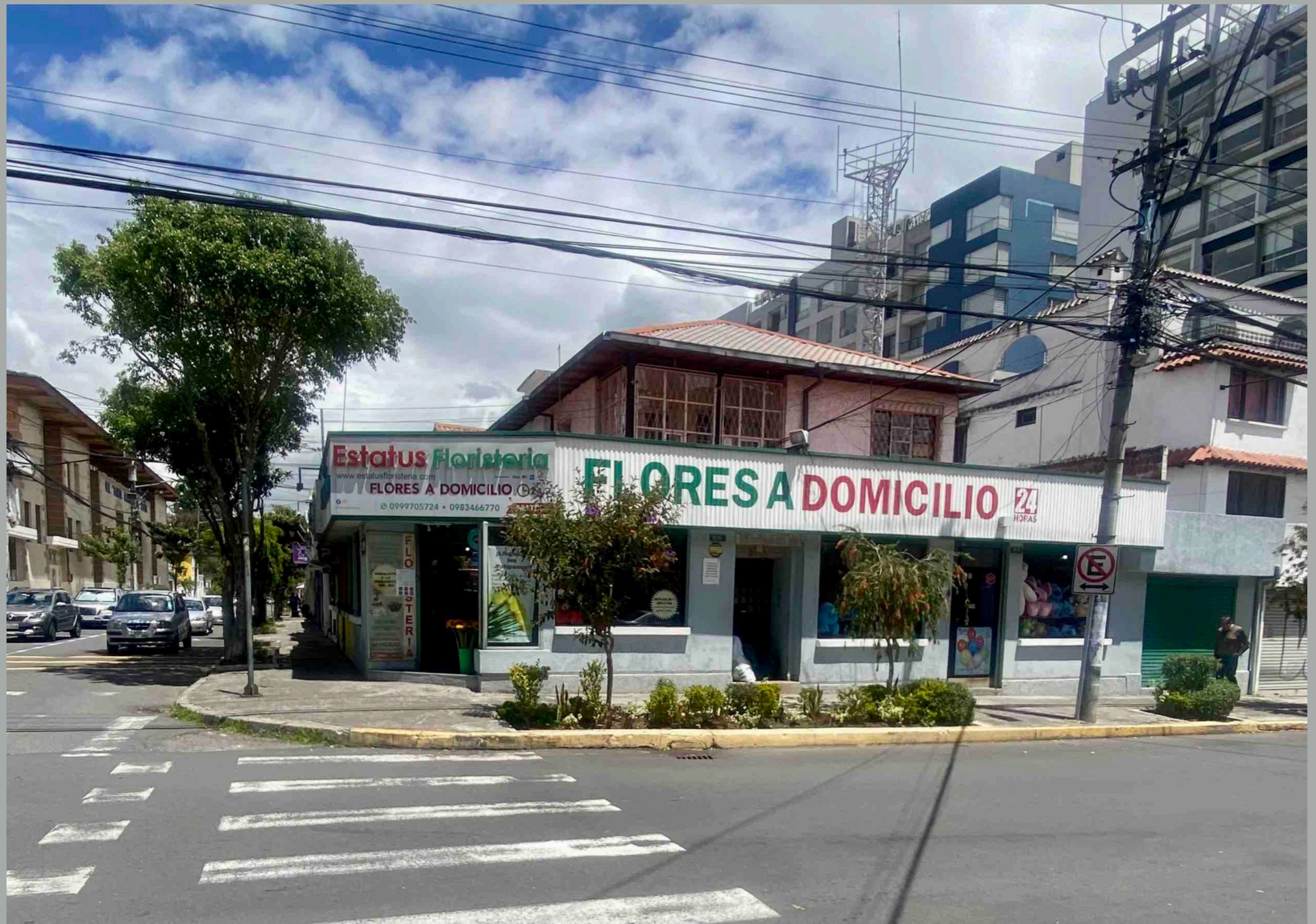
Roca y Tamayo