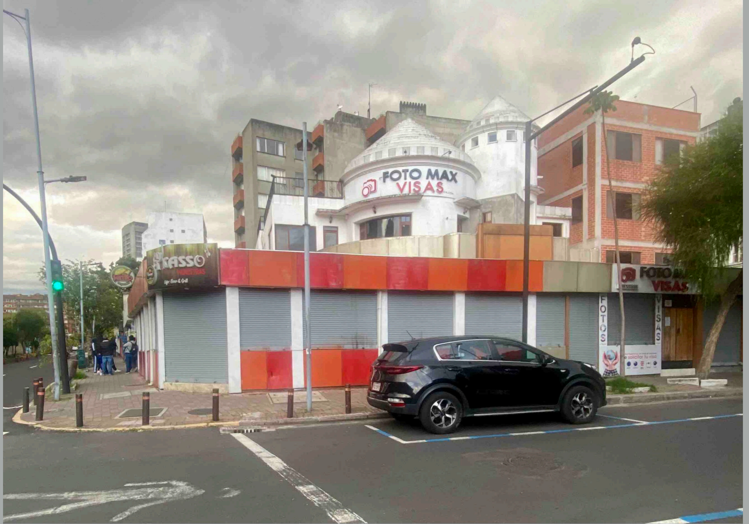
Roca y Reina Victoria