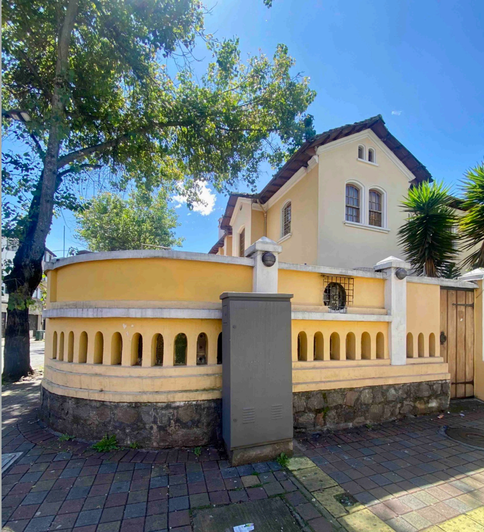
Foch y Juan León Mera