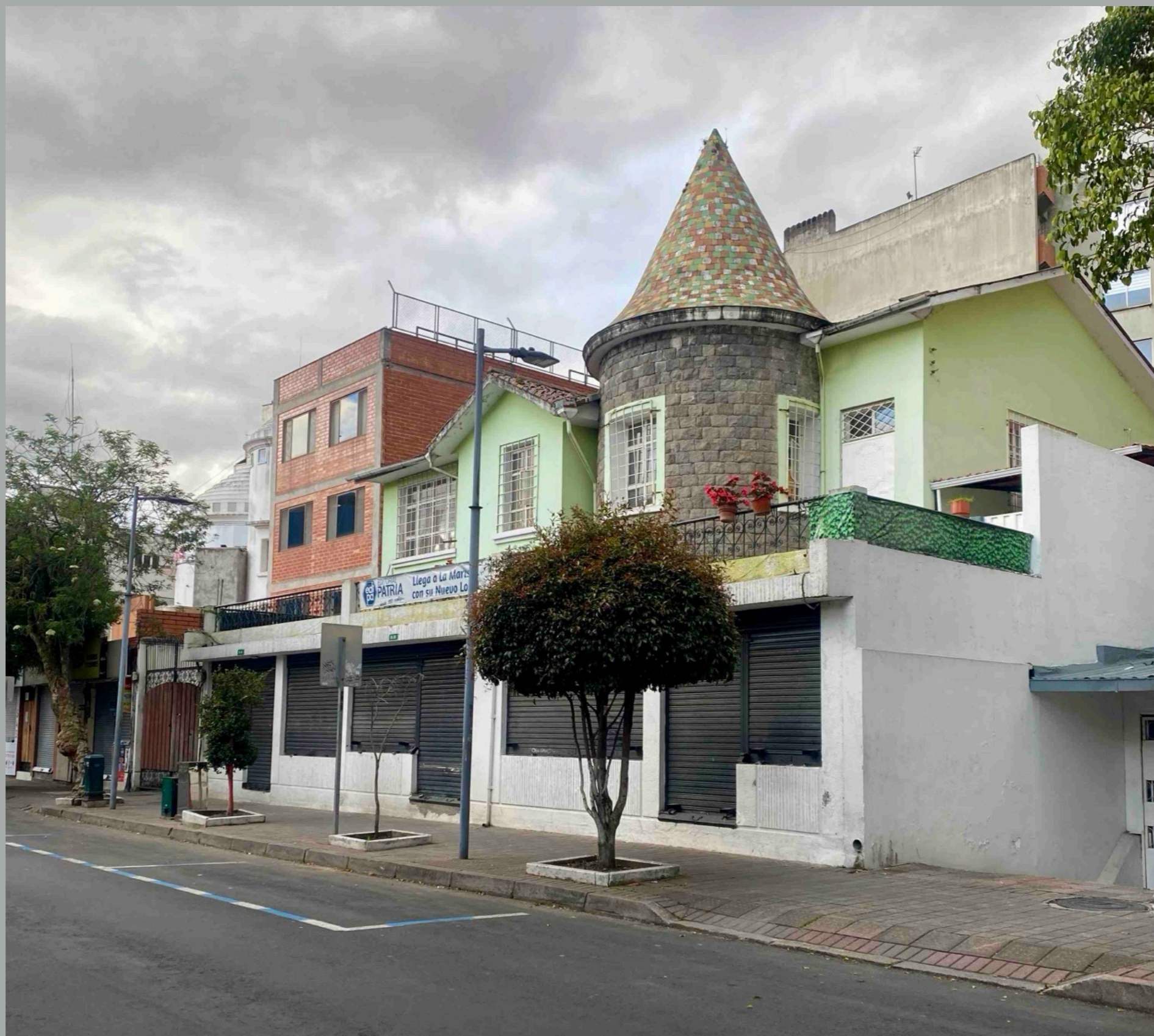
Roca y Reina Victoria