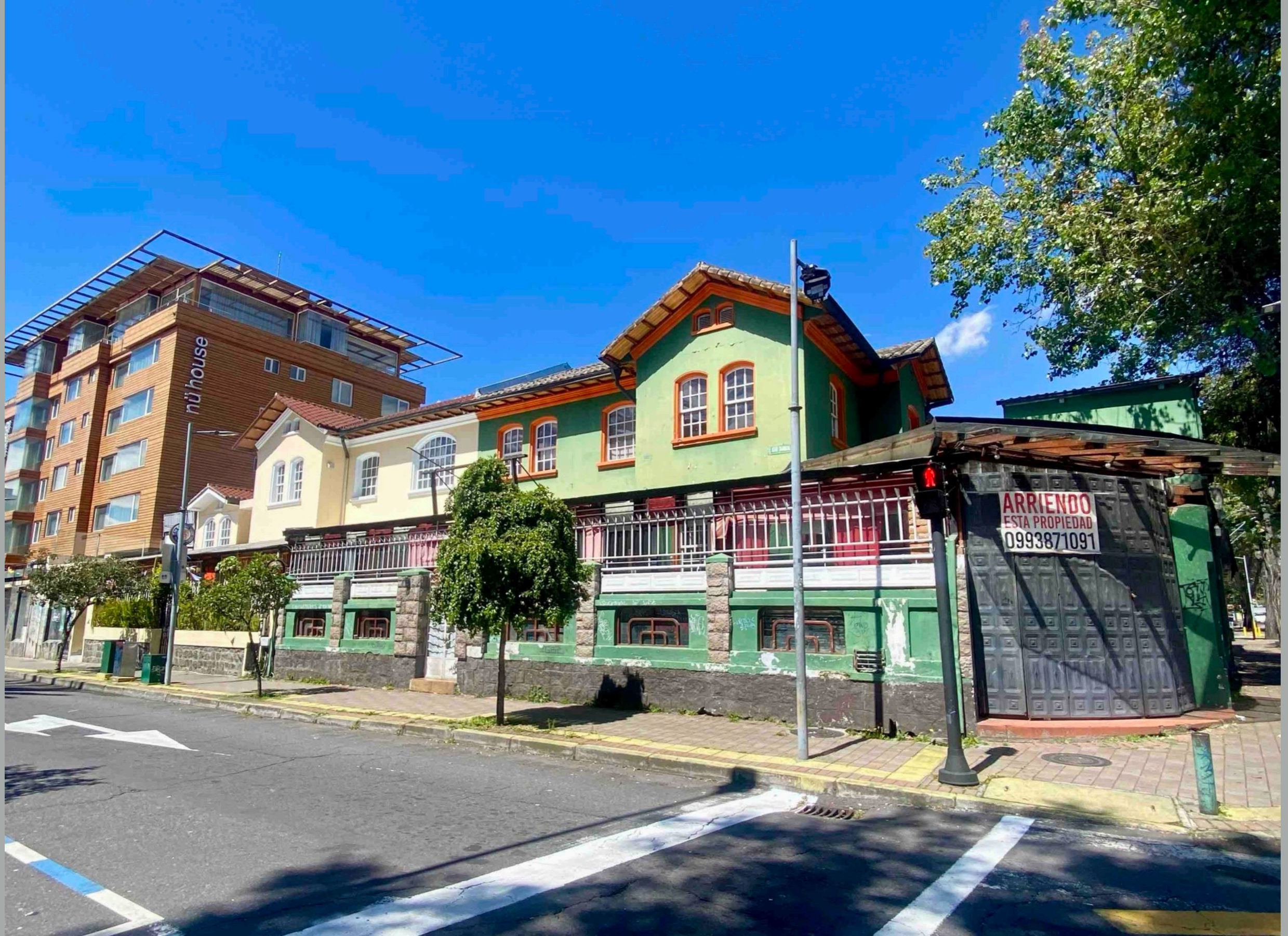
Foch y Juan León Mera