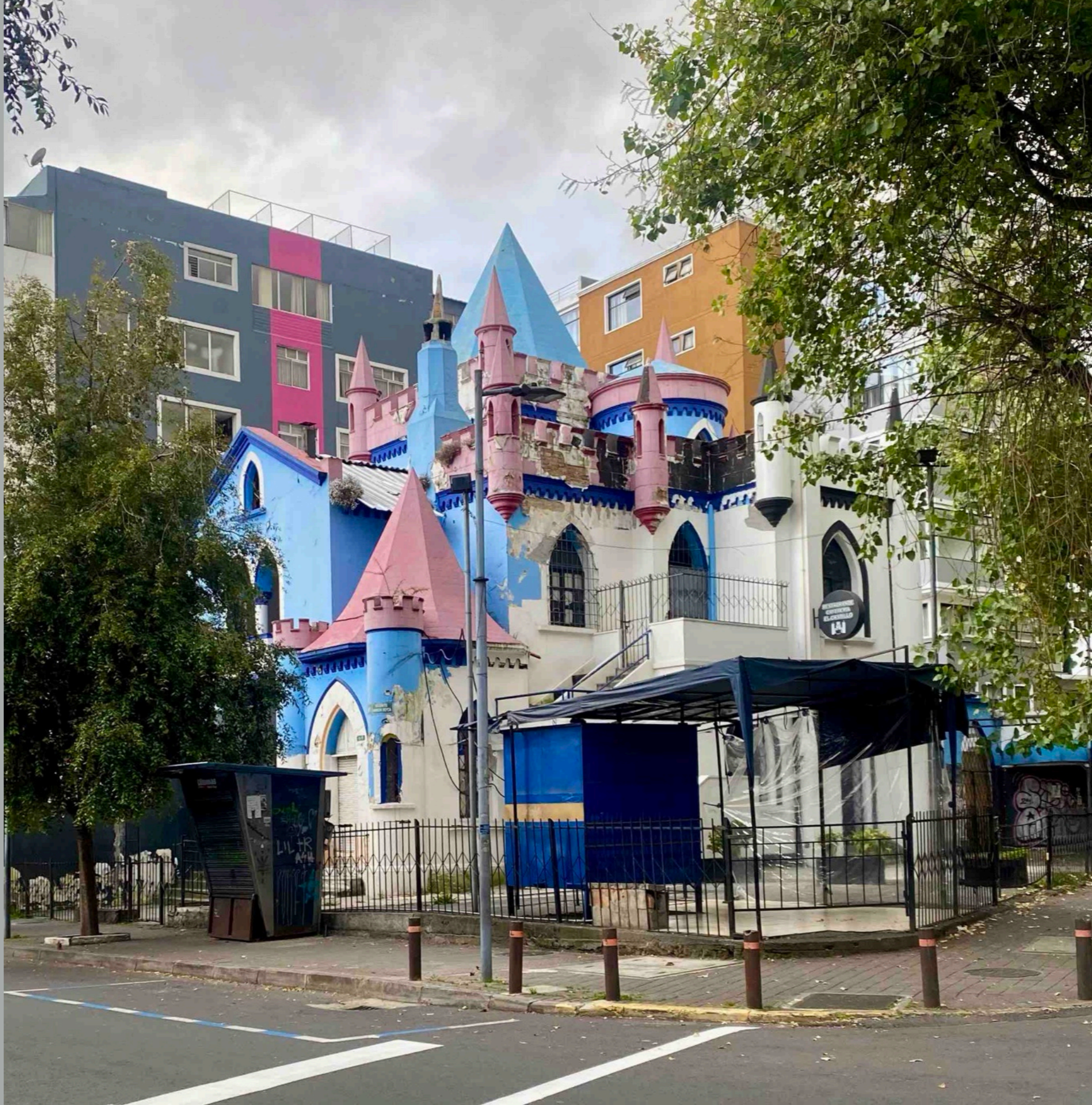
Juan León Mera y Roca