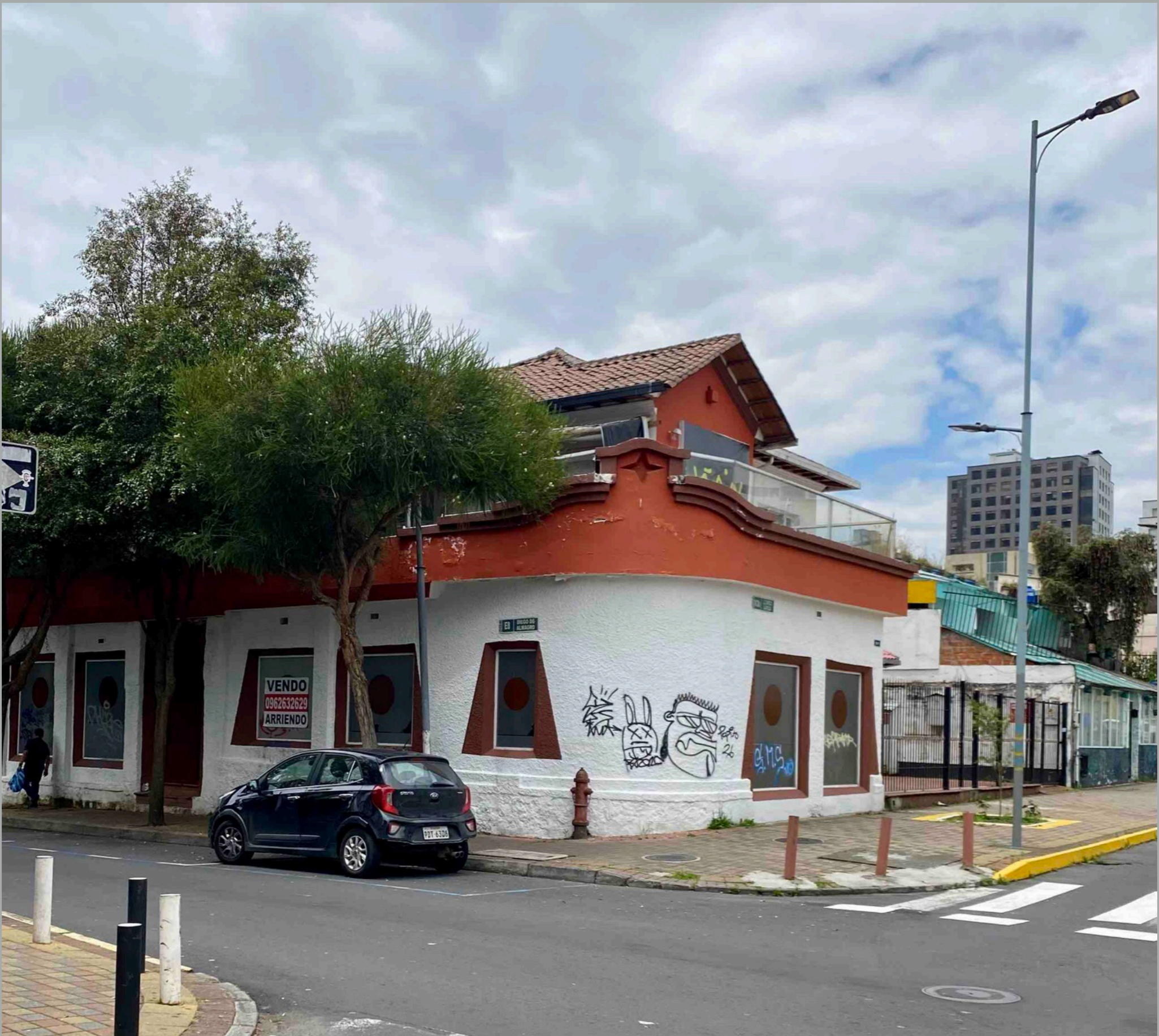
Lizardo García y Diego de Almagro