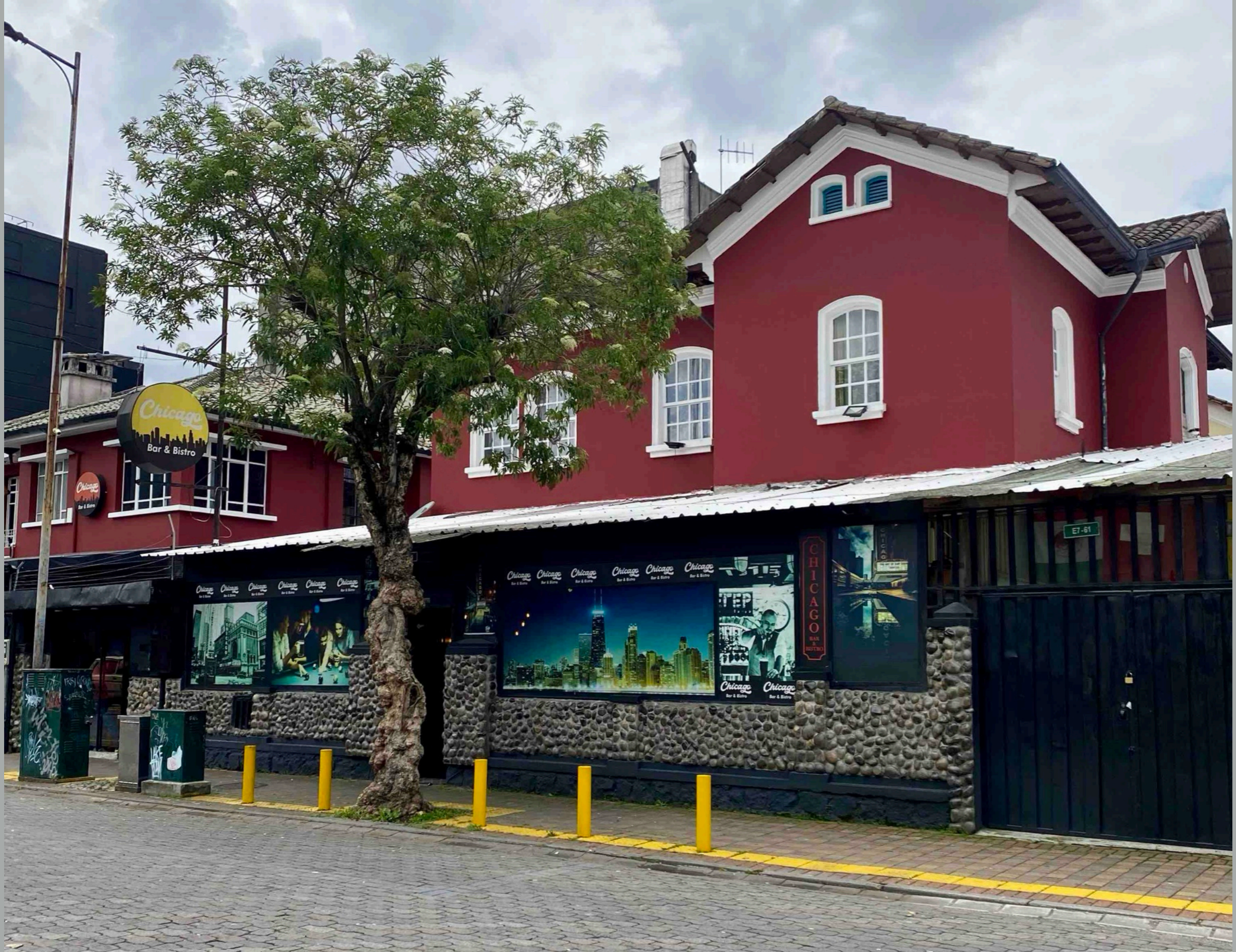
Joaquín Pinto y Diego de Almagro