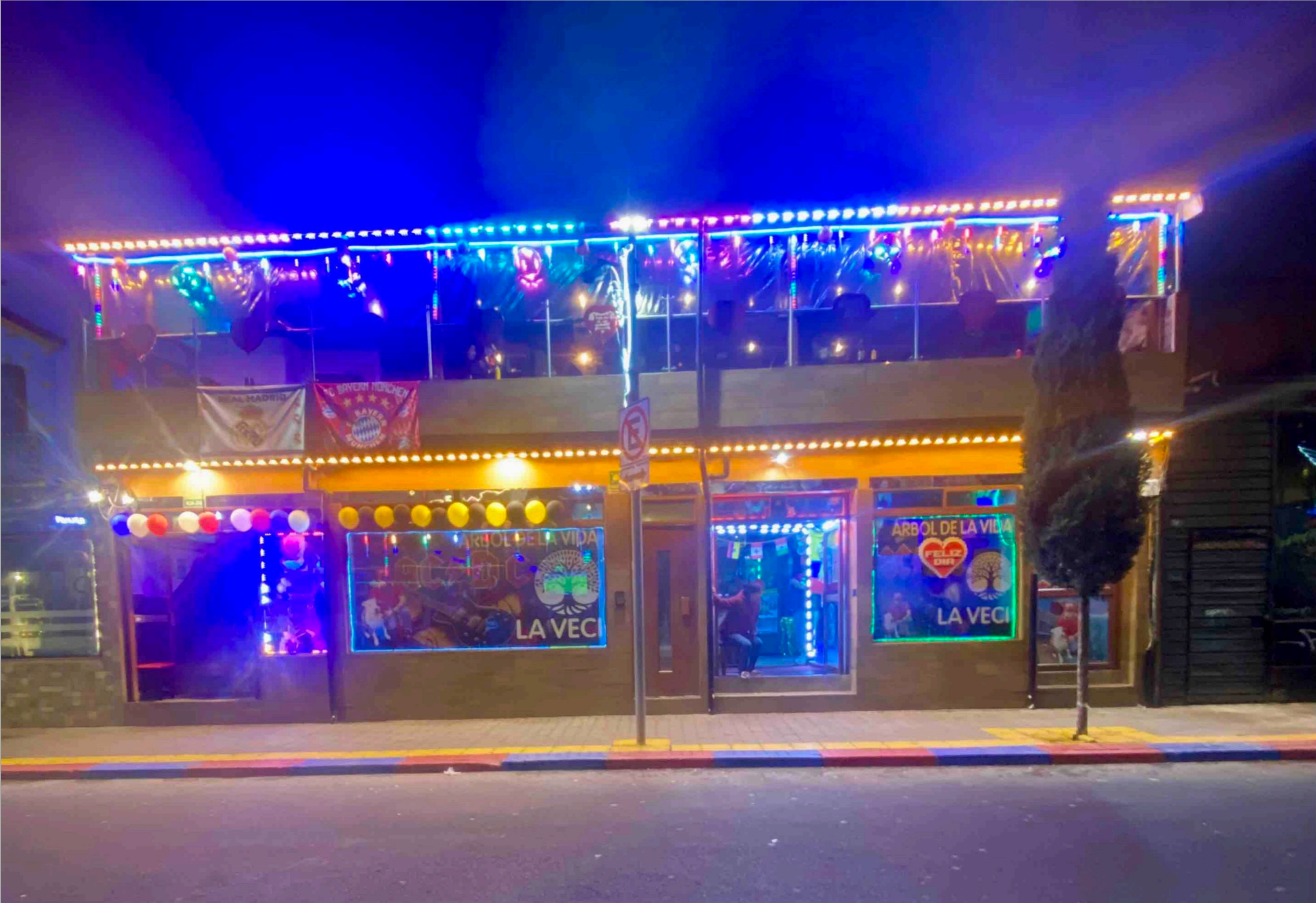
Reina Victoria e/Lizardo Garcia y Calama