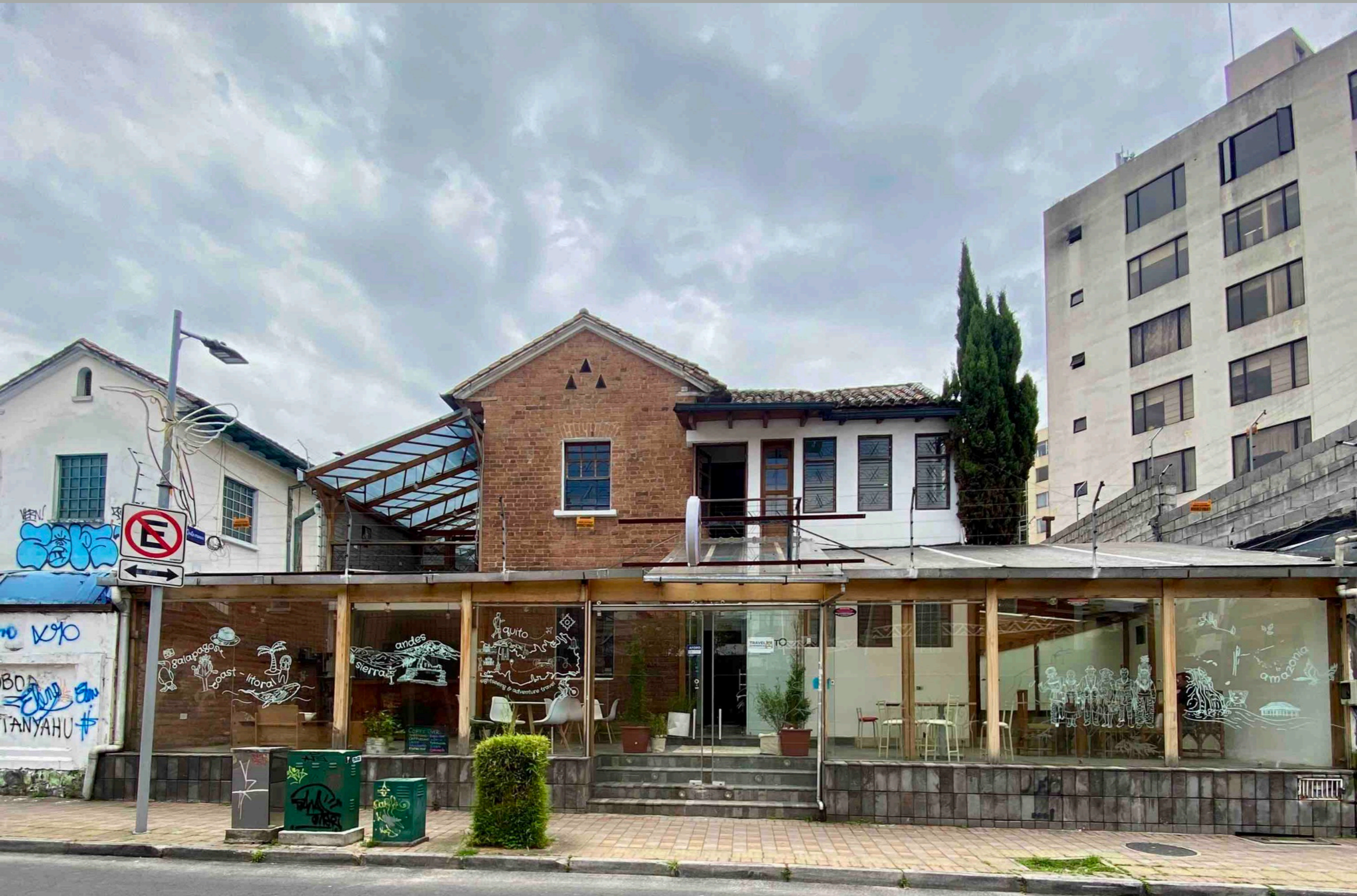
Reina Victoria y Lizardo Garcia -Galería Ecuador-