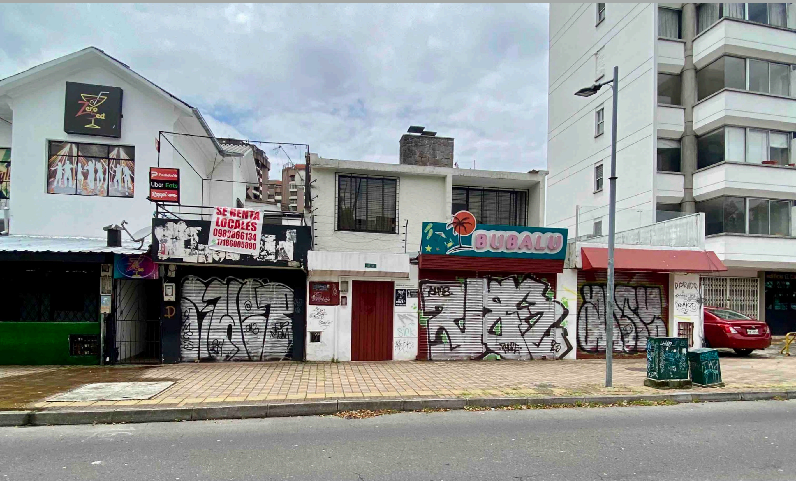
Lizardo García y Diego de Almagro