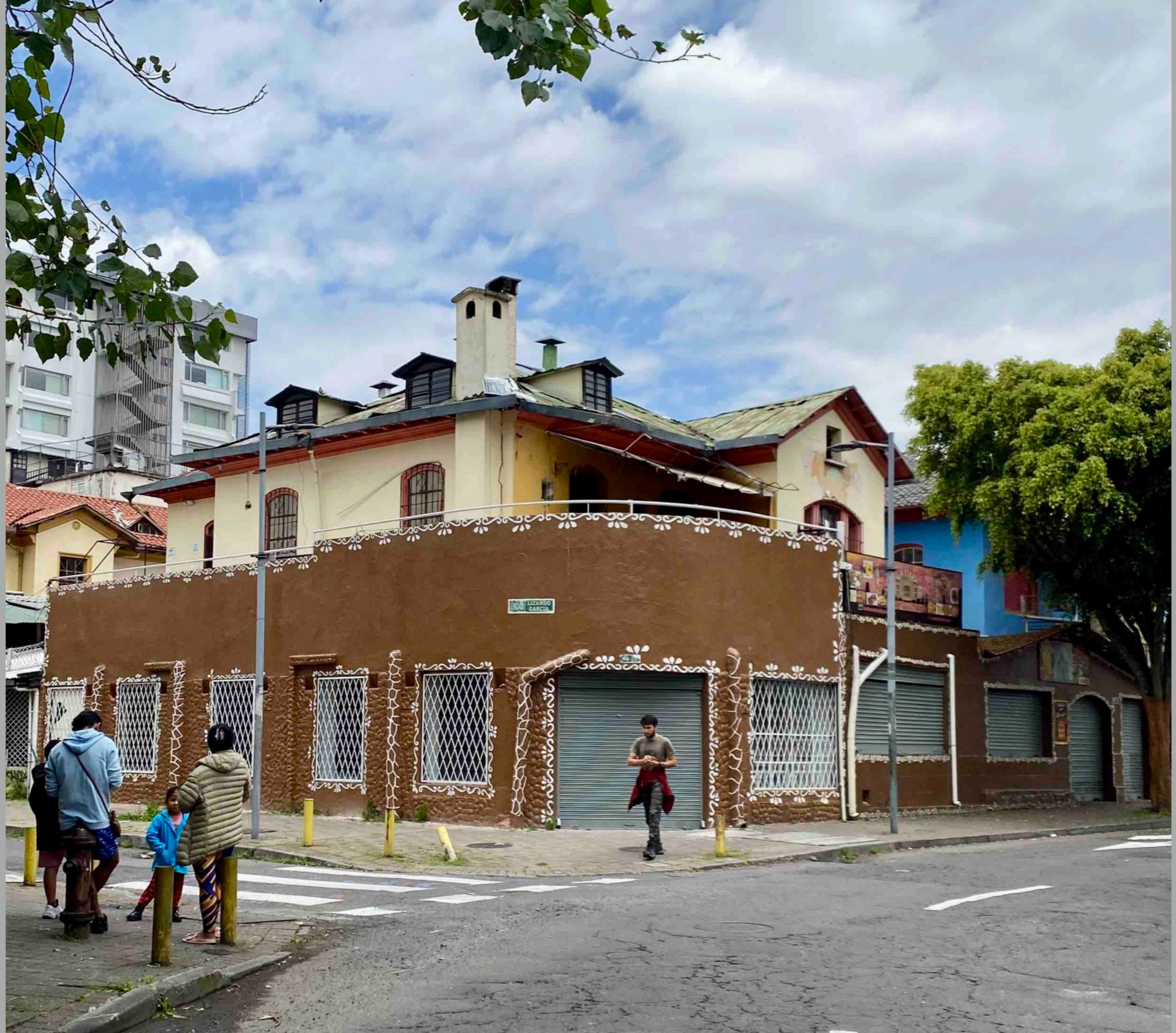
Juan León Mera y Lizardo García