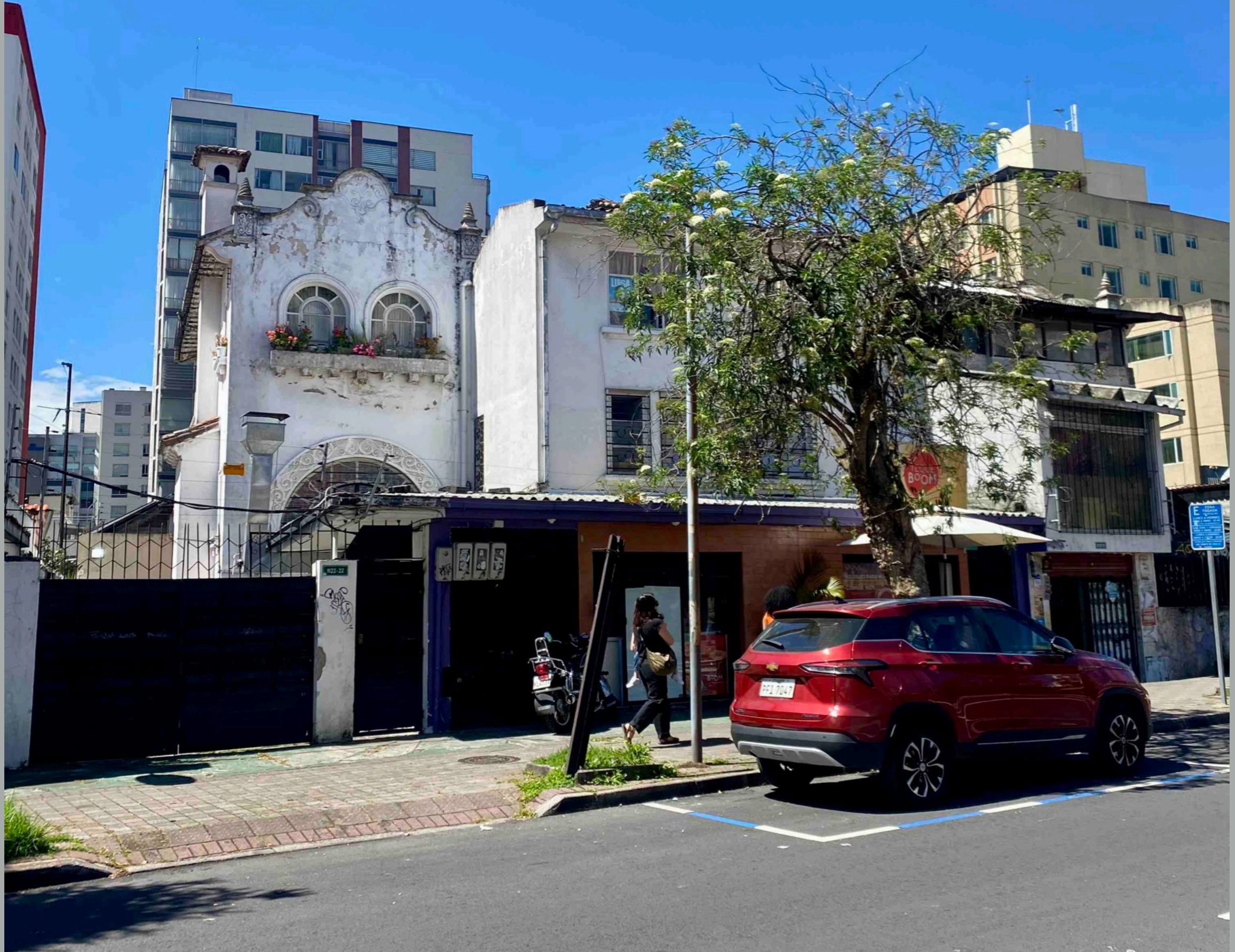
Reina Victoria e/ Veintimilla y Carrión