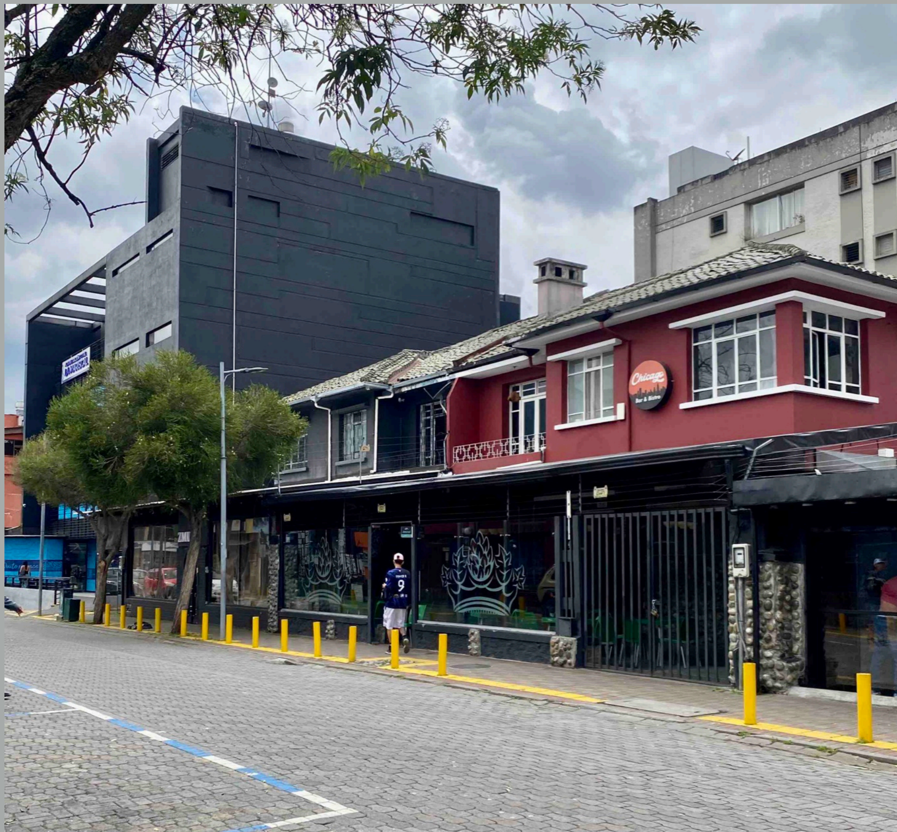
Joaquín Pinto y Reina Victoria