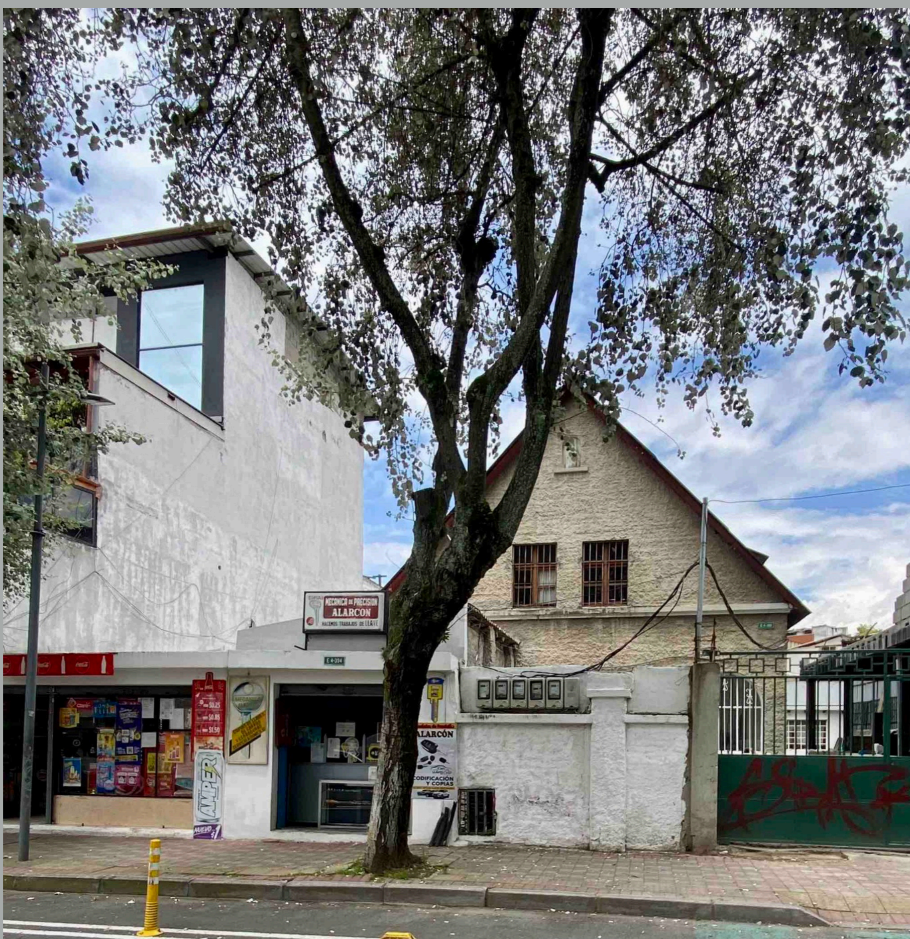
Luis Cordero y Juan León Mera